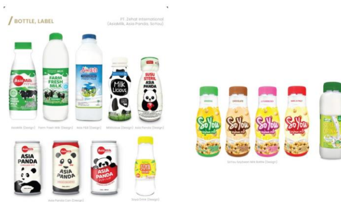
Gambar 2.5 Portfolio W Design Studio untuk Asiamilk

W Design Studio juga berkolaborasi dengan Asiamilk dari PT. Zehat Indonesia dengan mendesain label botol minuman dengan jenis susu yang berbeda-beda, terdapat produk Susu Segar, Asia Panda, dan SoYou. Masing-masing varian susu ini memiliki karakteristik rasa dan target konsumen yang berbeda, sehingga desain label yang dihasilkan pun disesuaikan dengan segmentasi pasar yang dituju.