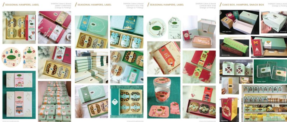
Gambar 2.3 Portfolio W Design Studio untuk Shereen Bakery

Untuk klien Shereen bakery ini ada berbagai varian packaging , mulai dari hampers cookies, snack box, dessert box, paperbag, sticker label, kartu ucapan, dan bread bag hvs dengan desain yang berbeda-beda sesuai dengan hari raya, seperti Chinese New Year, Hari Raya Idul Fitri, Natal, dan tahun baru . Bukan hanya mendesain box packaging , W Design Studio juga menawarkan jasa mendesain brand packaging mulai dari bottle, snack, sachet, dan pouch .