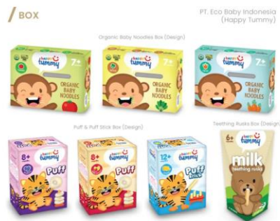
Gambar 2.4 Portfolio W Design Studio untuk Happy Tummy