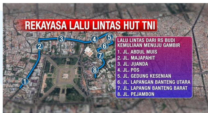
Gambar 2.5 Rekayasa Lalu Lintas HUT TNI

Berikut ini merupakan berita mengenai adanya rekayasa lalu lintas untuk hari ulang tahun TNI. Berita ini ditayangkan pada program iNews Pagi untuk menyampaikan informasi kepada penonton agar