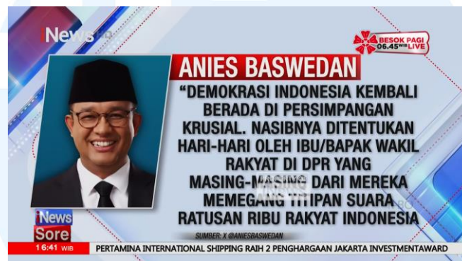
Gambar 2.3 Grafis Quote Anies Baswedan

Berita ini merupakan berita kategori Breaking News dimana pembahasan topikny merupakan ajakan-ajakan warganet di sosial media seperti Instagram , Tiktok , dan juga Twitter untuk kawal keputusan MK mengenai Pilkada 2024, dikarenakan adanya pihak-pihak tertentu yang ingin menghilangkan keputusan tersebut sehingga warganet murka dan ingin menolak tindakan tersebut. Dari lampiran tersebut, terlihat ada sebuah grafis buatan dari divisi grafis mengenai ucapan pak Anies Baswedan mengenai peristiwa tersebut.