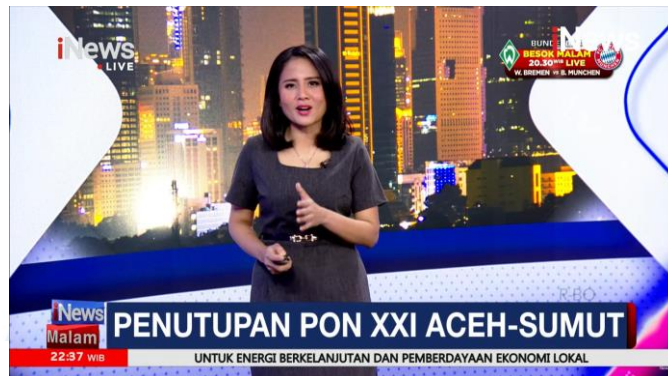
Gambar 2.4 Upacara Penutupan PON Aceh-Sumut 2024

Berita ini merupakan penayangan untuk iNews Malam ketika upacara penutupan untuk Pekan Olahraga Nasional (PON) 2024 Sumatera Utara sedang terjadi secara langsung. Berita ini memiliki kolaborasi dari divisi-divisi iNews seperti news graphic beserta layout dari tim grafis dalam bentuk kotak untuk running text, dilengkapi dengan running text dan juga keterangan waktu langsung dari divisi editor dan studio.