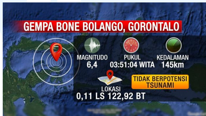
Gambar 2.6 Grafis Gempa Bone Bolango, Gorontalo

Berikut ini merupakan berita yang ditayangkan di program iNews Siang, dimana berita tersebut menginformasikan kepada penonton bahwa telah ada kejadian gempa bumi di Gorontalo sebesar magnitudo 6,4 pada pukul 03:51 WITA. Berita ini dilengkapi dengan news graphic yang telah dibuat oleh tim grafis agar penonton dapat lebih memahami berita tersebut secara detail.