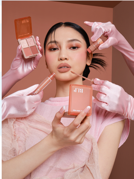
Gambar 2. 6 Butter Fudge Collection

dirancang agar mudah diaplikasikan kapan saja dan di mana saja. Selain itu, produk ini memiliki ukuran yang compact , sehingga dapat dengan mudah disimpan di saku celana atau baju, semakin menekankan aspek fungsionalitas dan kenyamanannya untuk penggunaan sehari-hari.