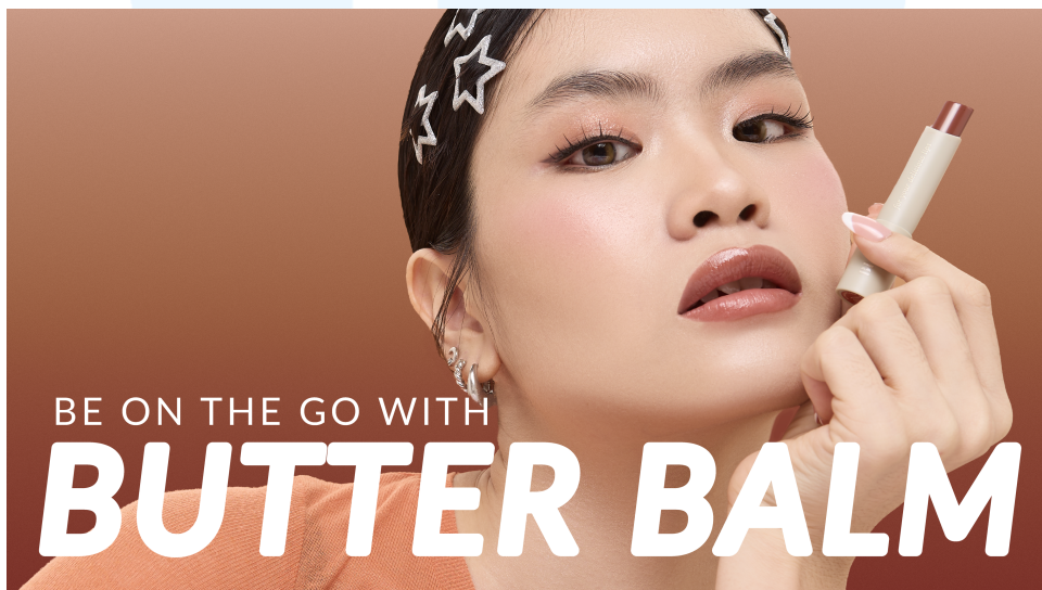
Gambar 2. 5 Gambar Thumbnail EWB Butter Balm

BLP Beauty menghadirkan sebuah ekosistem positif yang didukung oleh produk-produk berkualitas tinggi serta solusi yang berdampak signifikan bagi masyarakat dan lingkungan, melalui kampanye kolaborasi BLP Beauty X Tuku dengan tagline #SenyumTetangga. Pesan yang disampaikan oleh Andano Prasetyo, Founder Tuku, dan Lizzie Parra, Founder BLP Beauty, adalah: "Berangkat dari titik awal yang sama, mengeksplorasi rasa dan warna melalui karya, terinspirasi oleh keluarga dan tetangga, membawa semangat lokal menuju skala global, dan menenun kisah baik dalam setiap pencapaian, yang dimulai dengan berbagi satu senyuman." Kampanye BLP X Tuku, yang diluncurkan pada Juni 2023, langsung menjadi favorit di kalangan masyarakat.