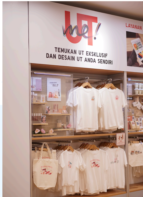
Gambar 2. 7 BLP Beauty X Tuku

Kolaborasi BLP Beauty dan Uniqlo UT Me menghadirkan perpaduan unik antara makeup dan fashion dengan konsep " Find Your Joy. " Kolaborasi ini melibatkan lima desain ilustrasi kaos dan satu tas eksklusif. Kelima ilustrasi tersebut meliputi My Liquid Asset , Investment , Committed Relationship , Daily of Joy , dan Let's Face It , hasil kreasi tim Creative internal BLP Beauty. Setiap desain menampilkan elemen makeup khas BLP Beauty yang dipadukan dengan tata letak artistik yang beragam.