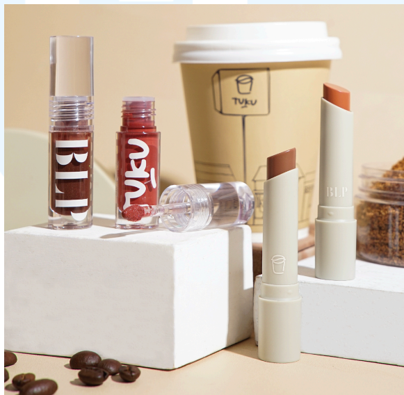
Gambar 2. 4 Gambar Produk BLP Beauty X Tuku

BLP Beauty telah meraih sejumlah penghargaan dari berbagai platform kecantikan yang menyelenggarakan penghargaan selama dua tahun terakhir. Di antaranya adalah penghargaan Best Lip Colour di Tokopedia Beauty Awards 2023, Best Lip Gloss di Female Daily Award 2023, Best Eye Liner di Female Daily Award 2022, serta Best Lip Color di Beautyfest Asia 2020. BLP Beauty mendapatkan pengakuan ini berkat produk-produk andalannya seperti Face Powder, Face Concealer, Dream Brow, dan Liquid Lipstick, serta beberapa produk unggulan lainnya.