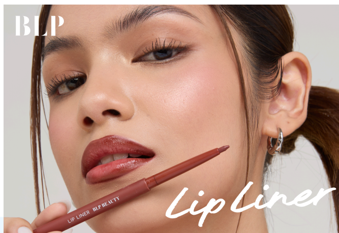
Gambar 2. 8 Lip Liner

Pada Oktober 2024, BLP Beauty kembali meramaikan dunia kecantikan dengan meluncurkan dua warna terbaru untuk produk Lip Liner, yaitu Classic Beige dan Dusty Rose. Berbeda dari strategi sebelumnya, kali ini BLP Beauty hanya menghadirkan dua shades dengan desain kemasan yang seragam. Di masa lalu, formula Lip Liner belum mencapai kualitas terbaik, namun peluncuran kali ini membawa peningkatan yang signifikan. Sebelum resmi diluncurkan, tim internal BLP Beauty berfokus pada pengembangan formula untuk memastikan produk ini lebih unggul. Hasilnya, Lip Liner terbaru kini hadir dengan warna yang lebih pigmented , daya tahan lebih lama, serta tampilan yang lebih bold dan memberikan kesan statement .