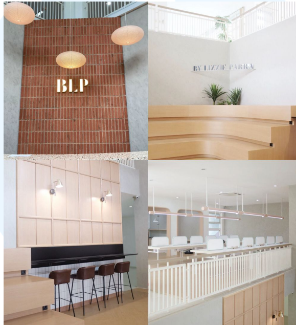
Gambar 2. 2 BLP Beauty Headquarters

dengan elemen unik berupa potongan di bagian tengah masing-masing huruf. Desain ini tidak hanya menonjolkan kesederhanaan, tetapi juga memberikan sentuhan kontemporer yang memperkuat identitas visual merek, sehingga tetap menarik dan mudah diingat oleh konsumen.