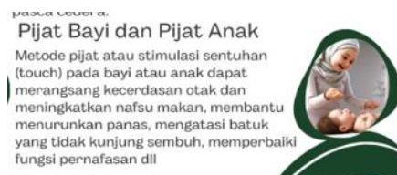
Gambar 2.5 Layanan homecare pijat bayi dan anak

Klinik Sehat Serpong menyediakan layanan khusus untuk ibu dan bayi, termasuk pijat bayi yang meningkatkan kesehatan kulit serta memberikan relaksasi. Untuk ibu, tersedia pijat pasca melahirkan yang membantu pemulihan tubuh, meredakan ketegangan, dan melancarkan peredaran darah. Selain itu, layanan perawatan di rumah, seperti pijat bayi dan perawatan bagi ibu hamil atau pasca melahirkan, memberikan kemudahan dan kenyamanan tanpa perlu mengunjungi klinik.