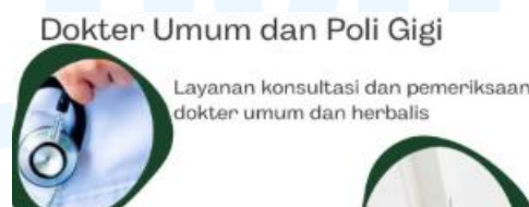
Gambar 2.3 Layanan dokter umum

Layanan Klinik Sehat Serpong menyediakan berbagai layanan kesehatan utama yang dirancang untuk memenuhi kebutuhan pasien secara menyeluruh. Layanan pertama adalah Pelayanan medis umum, yang mencakup konsultasi dengan dokter umum serta pemeriksaan dan pengobatan untuk berbagai kondisi kesehatan. Memberikan solusi cepat dan tepat atas masalah kesehatan dasar yang sering dialami masyarakat. Pemeriksaan kesehatan yang ditawarkan meliputi pemeriksaan menyeluruh yang memungkinkan deteksi dini berbagai penyakit, serta pengobatan untuk kondisi medis umum guna memastikan pasien mendapatkan perawatan terbaik.