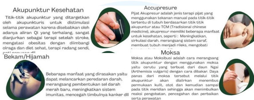
Gambar 2.4 Layanan holistik klinik

berbagai keluhan, seperti nyeri, stres, dan gangguan sirkulasi darah. Klinik juga menawarkan terapi bekam, sebuah teknik tradisional membantu mengeluarkan darah kotor untuk meningkatkan sirkulasi darah.