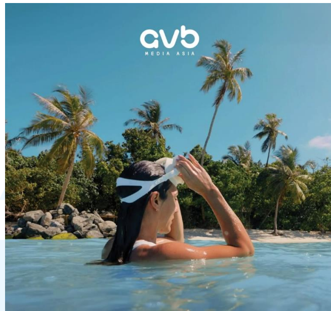
Gambar 2.4 Portofolio Website AVB Media Asia

Pada portofolio kedua merupakan promosi iklan yang bekerjasama antara AVB Media Asia dengan Jimbaran Convention Center di Intercontinental Bali. Iklan ini memperlihatkan ruang pertemuan yang dapat melengkapi keperluan berbagai rapat dan acara. Mengambil pengambilan gambar yang berlokasi di Jimbaran dan