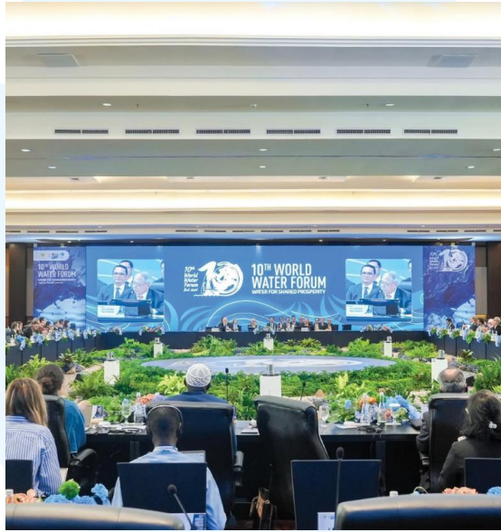
Gambar 2.6 Portofolio dokumentasi AVB Media Asia untuk 10th World Water Forum

Portofolio ketiga merupakan hasil foto dan video upacara yang diambil oleh tim AVB Media Asia khususnya Alpha Seven dari acara besar yaitu 10th World Water Forum yang mengenalkan tentang kemajuan dalam sustainable