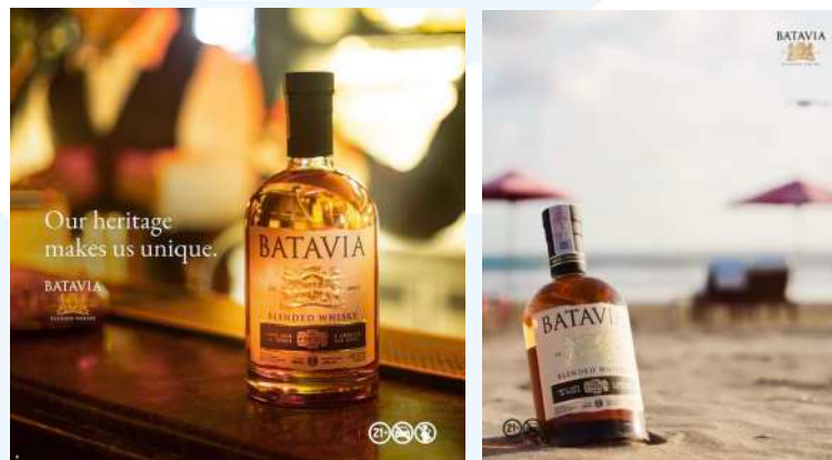
Gambar 2. 4 Kolaborasi Kanekin dan Batavia

Semenjak tahun 2022 Kanekin Creative telah menjadi partner kerjasama Batavia untuk jasa sosial media dan design content . Dalam hal ini Kanekin menawarkan jasa foto produk yang diambil di studio, bar ataupun tempat yang mendukung tema dari pesan yang ingin disampaikan dari produk terhadap klien.