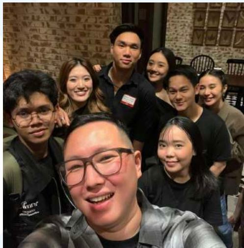
Gambar 2. 2 Event Dapur Social

Pertama kali didirikannya Kanekin yaitu tanggal 30 Juli 2014 berawal dari sebuah proyek freelance yang menawarkan jasa desain brochure untuk sebuah perusahaan yang bergerak dibidang farmasi. Kemudian, dari proyek tersebut Kanekin mulai dikenal dan berkembang menjadi sebuah agency yang melayani berbagai macam kebutuhan seperti desain majalah, kebutuhan lifestyle , marketing serta event .