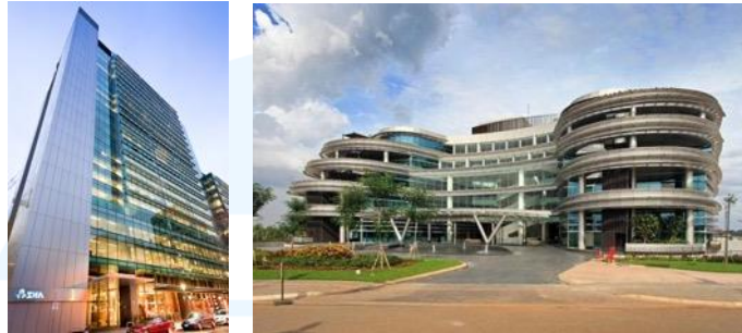
Gambar 2. 6 Residential Sinar Mas Land (Navapark, BSD)