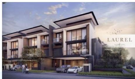
Gambar 2. 8 Residential Sinar Mas Land (Navapark, BSD)

Merupakan konstruksi properti untuk orang-orang yang ingin merasakan tinggal di komunitas multikultural yang serba modern dan hidup. Proyek pembangunan perumahan bersifat internasional dan domestik. BSD City (BSD), Jakarta, Bogor, Tangerang, Depok, Bekasi, Cikarang, Cibubur, Surabaya, Balikpapan, Batam, Taicang, dan Chengdu adalah beberapa proyek pembangunan di dalamnya.