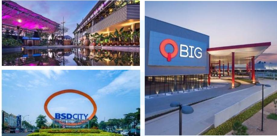
Gambar 2. 5 Township Sinar Mas Land (BSD City, QBig, dan The Breeze)

Wisata (Bekasi), Kota Wisata (Cibubur), Kota Deltamas (Cikarang), dan Grand City Balikpapan.