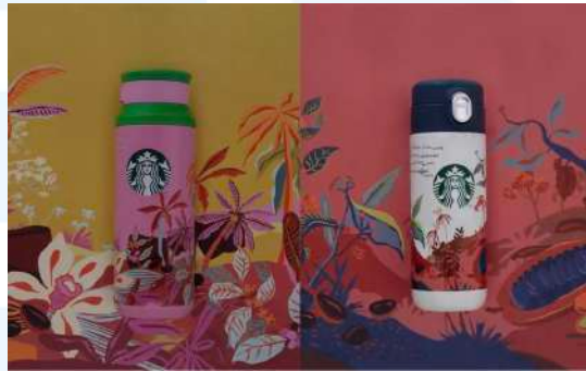
Gambar 2. 3 Foto produk hasil kolaborasi Artcamp Studio dan Starbucks

Pemilihan elemen flora ini berdasarkan pertimbangan untuk menghasilkan kolaborasi yang tetap menunjukkan keunikan dari pihak Starbucks sebagai merek yang menjual kopi dan juga dari pihak Rachel Ajeng dan Artcamp Studio.