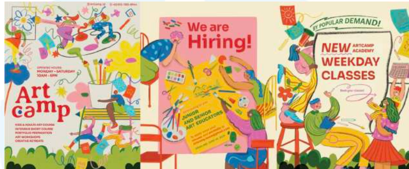
Gambar 2. 4 Hasil perancangan media kolateral Artcamp Academy

juga seminar. Pelaksanaan kegiatan-kegiatan tersebut awalnya diadakan secara daring, terutama pada masa-masa pandemi. Pada tahun 2024 akhirnya Artcamp Academy membuka tempat untuk mengadakan les di daerah Gading Serpong, dan dalam proses pembukaan tempat les tersebut, Artcamp melakukan perancangan media kolateral untuk Artcamp Academy.