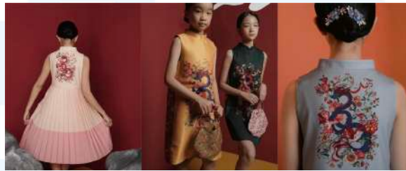
Gambar 2. 2 Foto produk hasil kolaborasi Artcamp Studio dan Kakapo

Pada kesempatan ini, Kakapo menjalin kerja sama dengan Artcamp Studio untuk peluncuran koleksi baju untuk perayaan hari raya Imlek di tahun 2024. Artcamp Studio pada kerja sama ini menyediakan desain ilustrasi berbentuk bunga dan naga untuk pattern pada baju yang diproduksi oleh Kakapo. Ilustrasi naga dibuat menyatu dengan ilustrasi bunga, seperti naga yang keluar dari tanaman dan bunga-bunga.