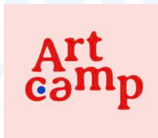
Gambar 2. 1 Logo Perusahaan Artcamp

Artcamp adalah sebuah wadah seni yang didirikan pada tahun 2018 dengan berawal dari sebuah komunitas kreatif. Artcamp berdiri dengan visi untuk menciptakan ruang yang ramah dan inspiratif bagi orang-orang untuk berkumpul secara langsung, bebas dari rasa takut akan penilaian. Artcamp berkomitmen untuk membangun lingkungan yang mendukung perkembangan dan kolaborasi, di mana orang-orang dapat menjelajahi ide-ide mereka dengan rasa aman.