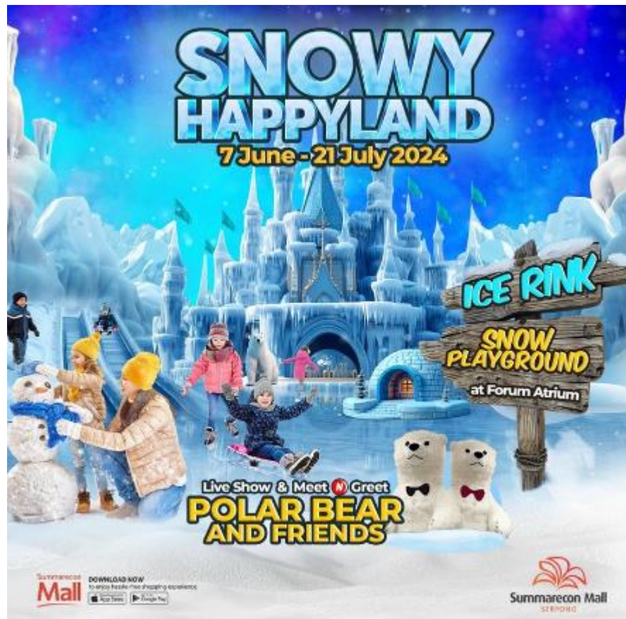
Gambar 2.6 Snowy Happyland

Snowy Happyland merupakan sebuah wahana bermain es skating yang biasa SMS adakan untuk menarik pengunjung terutama anak-anak yang suka dengan bermain salju dan es skating, event Snowy Happyland tahun ini diadakan pada 7 juni - 21 juli, event ini menjadikan area SMS sebuah arena es dan taman bermain salju yang berada di Forum Atrium Mall Summarecon, selain menjadi playground salju dan tempat es skating, Snowy Happyland juga ada pertunjukan dari beruang kutub yang lucu di akhir minggu event ini berlangsung, dan pengunjung bisa berfoto serta bermain bersama mereka.