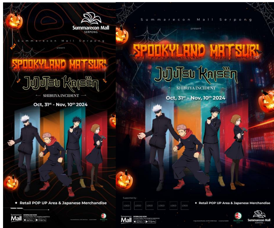
Gambar 2.9 Spookyland Matsuri

Spookyland Matsuri merupakan acara Halloween yang diadakan pertama kali oleh Summarecon Mall Serpong dengan menggandeng anime terkenal dari Jepang yaitu Jujutsu Kaisen. Konsep dari Event ini menggabungkan acara Halloween namun dengan tema Jepang, Spookyland Matsuri akan memberikan banyak penampilan mulai dari penyanyi, tarian dan cosplayer, dan ada kompetisi menggambar manga juga. Event ini akan banyak menjual merchandise bertema anime dan halloween, Spookyland Matsuri berlangsung mulai dari 31 Oktober sampai 10 November 2024.