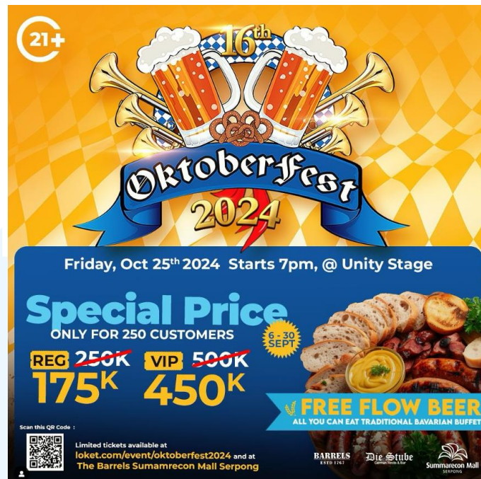
Gambar 2.7 Oktoberfest

Oktoberfest adalah festival tahunan yang merayakan budaya dan tradisi Jerman dengan penuh kemeriahan. Acara ini menyajikan berbagai macam bir, hidangan tradisional Jerman seperti bratwurst dan pretzel, serta hiburan musik dan tari. Oktoberfest merupakan kesempatan yang tepat untuk menikmati suasana yang meriah, bertemu dengan orang-orang baru, dan merasakan pengalaman yang unik dan menggembirakan.