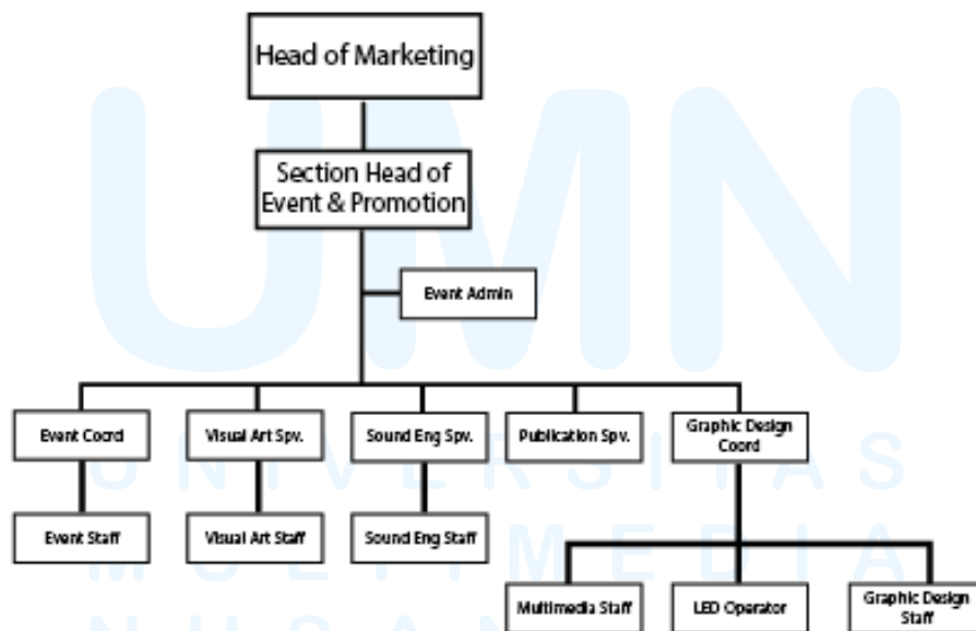
Gambar 2.3 Struktur Organisasi Divisi Marketing

PT. Lestari Mahadibya memiliki struktur organisasi yang dikepalai oleh seorang Unit Head. Seorang Unit Head memiliki tugas dan tanggung jawab atas seluruh unit dan divisi pada Management Office , Unit Head mengontrol setiap progress dan ikut serta dalam pembuatan dan pelaksanaan event di SMS, selain itu bertanggung jawab dalam pengawasan dan mengelola unit mall. Di Bawah seorang Unit Head ada General manager dan mengepalai dari 4 divisi utama yaitu Marketing manager , Operational manager , Engineering manager , dan HR Manager .