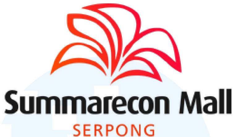
Gambar 2.2 Logo SMS

PT Lestari Mahadibya termasuk salah satu anak perusahaan dari PT. Summarecon Agung Tbk. (Summarecon). PT Lestari Mahadibya berlokasi di Summarecon Mall Serpong, Sentra Gading Serpong, Jl. Boulevard Raya Gading Serpong, Kelurahan Pakulonan Barat, Kecamatan Kelapa Dua, Kabupaten Tangerang, Provinsi Banten, 15810. PT Lestari Mahadibya mulai dikembangkan sejak tahun 2004 sebagai pusat bisnis dan juga komersial. Berdasarkan informasi dari website malserpong.com, PT Lestari Mahadibya ini menaungi Summarecon Mall Serpong (mall), Salsa Food City (pusat makanan), dan Sinpasa (pasar modern). PT Lestari Mahadibya ini lebih dikenal dengan nama Summarecon Mall Serpong. PT Lestari Mahadibya ini memiliki tujuan, visi dan misi, serta nilai inti yang sama dengan PT Summarecon Agung Tbk. (summarecon.com)