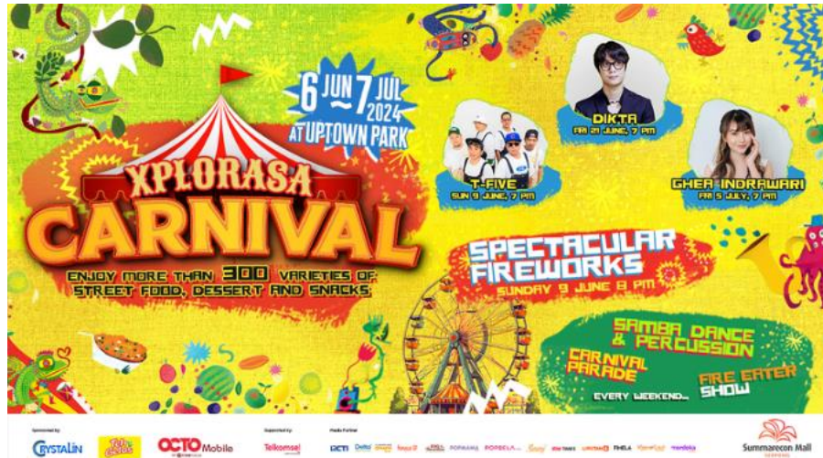
Gambar 2.5 Xplorasa Carnival

Xplorasa Carnival merupakan salah satu event besar yang diadakan oleh SMS dengan konsep berupa festival jajanan dan penampilan parade, event ini biasa berlangsung antara bulan juni sampai dengan bulan juli setiap tahunnya. Event ini sudah berjalan selama 3 tahun, di tahun 2024 event Xplorasa mengusung tema carnival dan samba yang diadakan pada 6 Juni - 7 Juli 2024. Xplorasa setiap tahunnya selalu ramai dengan lebih dari 300 jenis makanan kaki lima, makanan penutup, dan makanan ringan. adapun pengunjung bisa menikmati pertunjukan kembang api yang spektakuler, parade karnaval, pertunjukan pemakan api, dan tarian samba & perkusi setiap akhir pekan. Dalam event Xplorasa selain jajanan dan parade, Xplorasa selalu mengundang artis ternama tanah air. Di tahun ini Xplorasa mengundang T-Five, Dikta, dan Ghea Indrawari sebagai pengisi acara di event tersebut tiap minggunya.