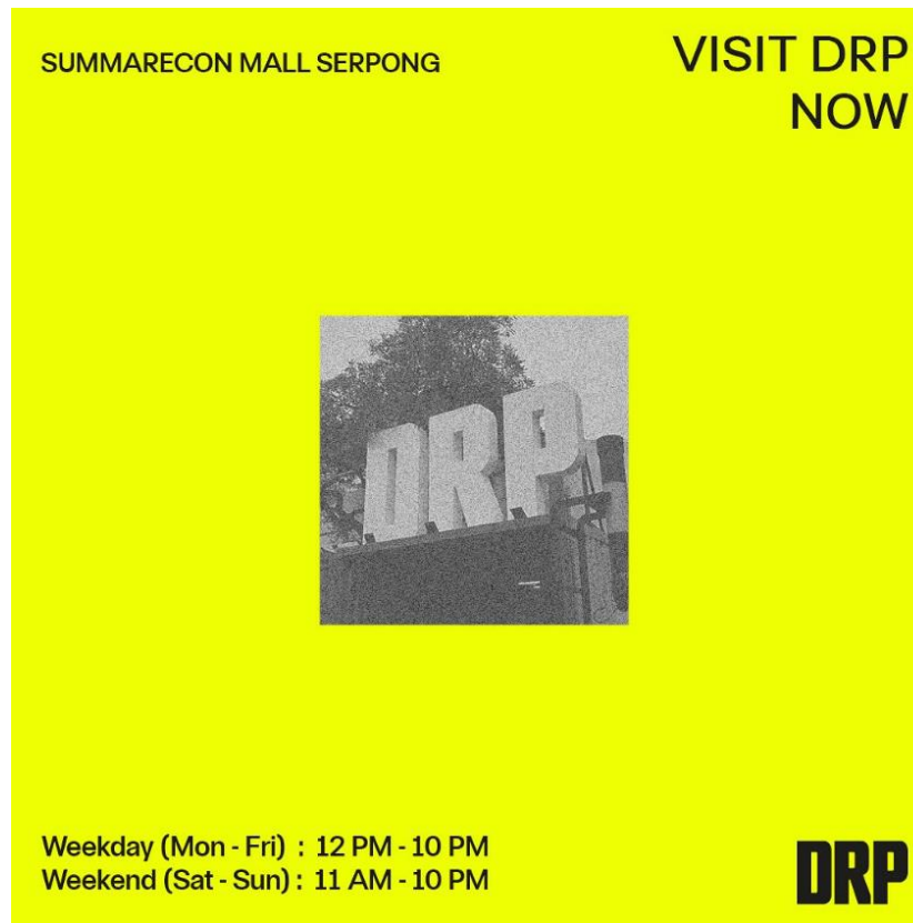
Gambar 2.8 DRP

DRP merupakan sebuah festival budaya streetwear dan pop yang berasal dari paris, dan untuk pertama kalinya DRP melakukan kerja sama dengan JF3 ( JF3 merupakan acara festival fashion yang diselenggarakan oleh Summarecon Mall) untuk membuat event DRP jakarta, SMS berkesempatan untuk menyelenggarakan acara ini dan berlangsung dari 26 Juli - 4 Agustus 2024. DRP mengundang brand streetwear terkenal dari paris dan banyak streetwear dari dalam negeri juga, selain menjual berbagai produk streetwear, DRP juga mengadakan penampilan fashion show, celebrity games, public skate, streetball competition, street dance, dan talkshow dengan narasumber dari brand Pablo T-shirt asal Paris. DRP semakin dimeriahkan dengan adanya penampilan artis hip-hop Indonesia yaitu Tuan Tigabelas dan Basboi.