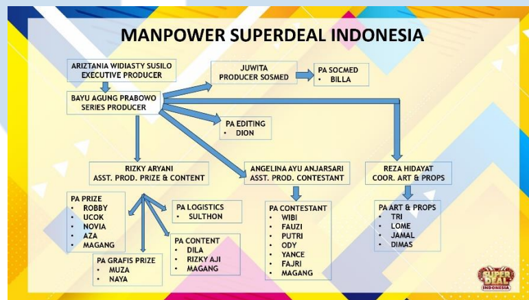
Gambar 2.2 Struktur Organisasi Super Deal Indonesia

Berikut struktur organisasi Super Deal Indonesia (PT. Dunia Visitama Produksi) Jakarta: