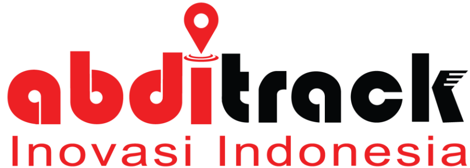
Gambar 2.1. Logo Perusahaan