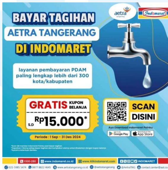
Gambar 2.3 Iklan Promosi Instagram

a) Kerjasama PT Aetra Air Tangerang dengan Indomaret