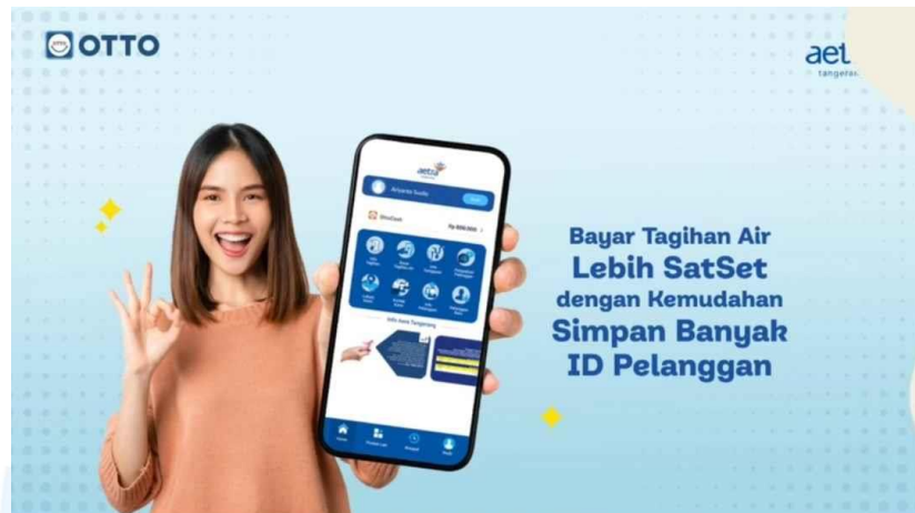
Gambar 2.4 Iklan Promosi Instagram

PT Aetra Air Tangerang juga melakukan kerjasama dengan perusahaan OTTO Digital untuk memudahkan pembayaran tagihan air minum. Iklan disini merupakan sebuah video yang menunjukkan sebuah ponsel seluler yang berisikan aplikasi dari PT Aetra Air Tangerang. Kalimat yang digunakan dalam video tersebut mudah dipahami dan menjangkau kepada masyarakat atau pelanggan dengan mudah. Desain dalam iklan promosi aplikasi ini tergolong simple dan mudah untuk dilihat tidak terlalu banyak kalimat yang perlu dibaca.