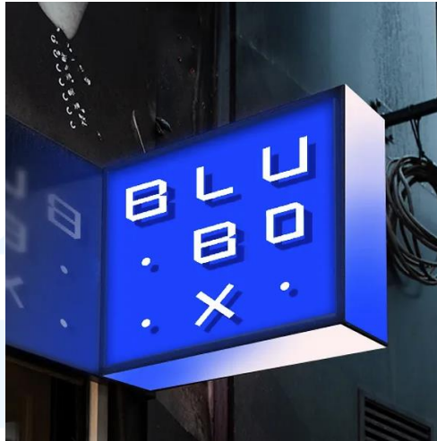
Gambar 2.3 Signage Logo Blubox

Blubox Cycling merupakan studio sepeda yang menawarkan produk kelas atas dan layanan bersertifikat yang menghargai community space -nya. Dalam proyek ini, Nootte and Netoo merancang branding dan identitas Blubox dengan tujuan untuk menunjukkan semangat kegembiraan dan memberikan nuansa kontemporer. Proyek ini dijalankan pada tahun 2020 dan Nootte and Netoo memegang penuh branding dari Blubox, mulai dari penamaan, logo, grafis, signage , media sosial dan berbagai media kolateral lainnya seperti item-item dari studio Blubox.