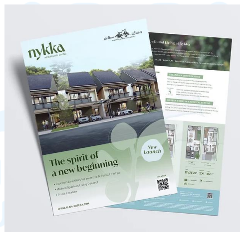
Gambar 2.4 Flyer Nykka

Blubox Cycling merupakan studio sepeda yang menawarkan produk kelas atas dan layanan bersertifikat yang menghargai community space -nya. Dalam proyek ini, Nootte and Netoo merancang branding dan identitas Blubox dengan tujuan untuk menunjukkan semangat kegembiraan dan memberikan nuansa kontemporer. Proyek ini dijalankan pada tahun 2020 dan Nootte and Netoo memegang penuh branding dari Blubox, mulai dari penamaan, logo, grafis, signage , media sosial dan berbagai media kolateral lainnya seperti item-item dari studio Blubox.