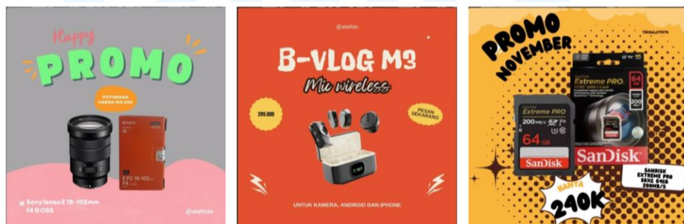
Gambar 1.4 Promotional Instagram Feeds Alat Foto