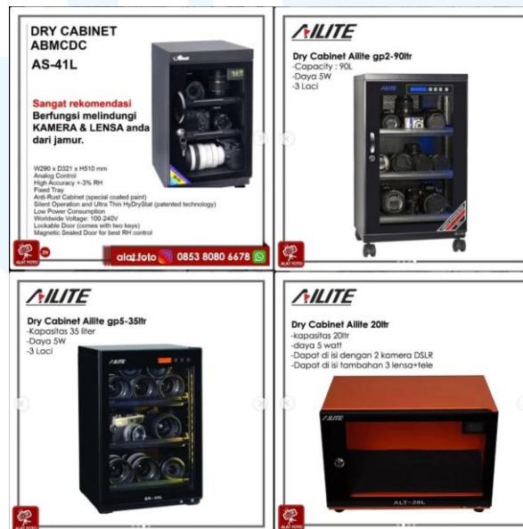
Gambar 1.5 Instagram Product Feeds Alat Foto

Untuk memperkenalkan produk-produk terbaru, Alat Foto juga mendesain feeds Instagram yang menampilkan produk-produk yang baru masuk atau sedang dijual. Postingan ini mencakup gambar produk dengan kualitas tinggi dan deskripsi yang informatif. Pendekatan ini membantu calon pelanggan memahami fitur dan keunggulan produk, sekaligus memperkuat citra profesional Alat Foto sebagai penyedia alat fotografi terpercaya.