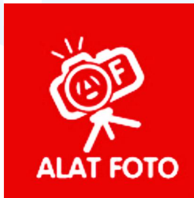
Gambar 1.1 Logo Alat Foto