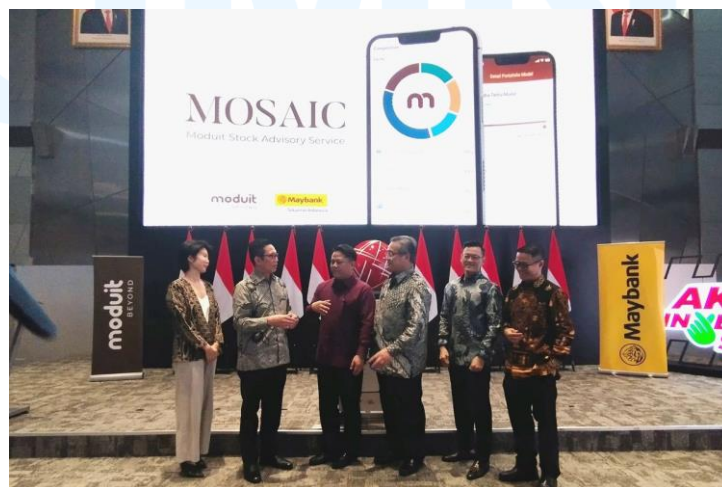
Gambar 2.3 Dokumentasi peluncuran MOSAIC