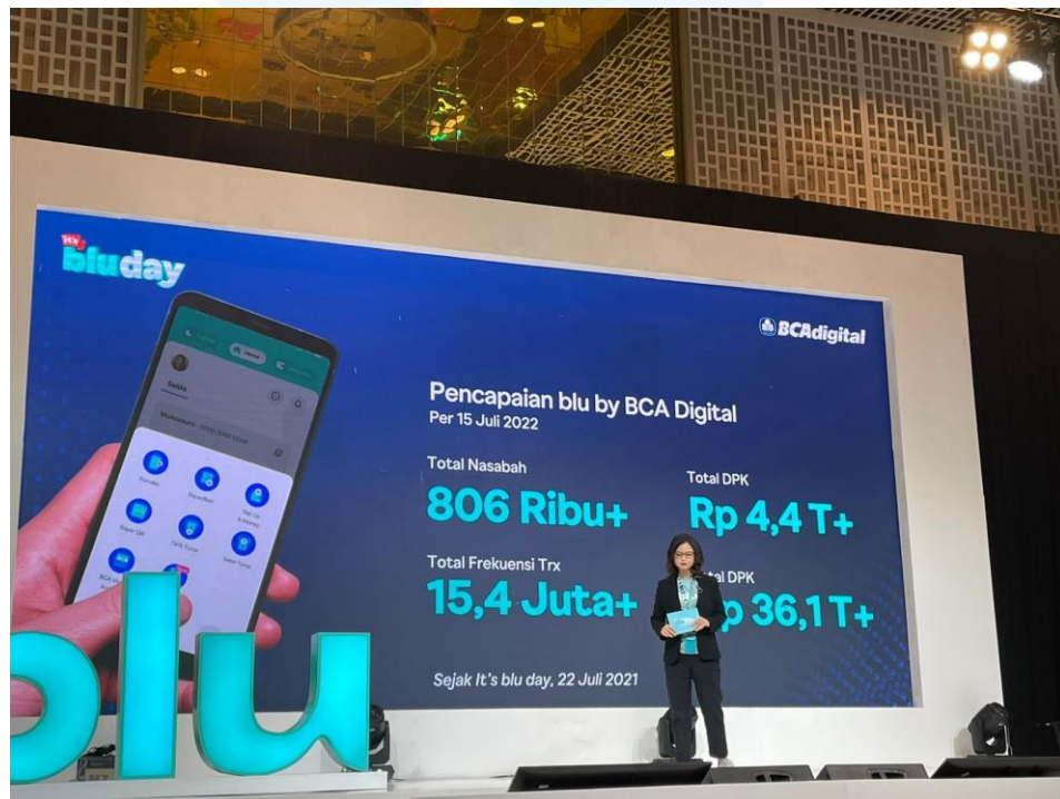
Gambar 2.5 Dokumentasi kolaborasi Moduit dan Blu by BCA

Moduit melakukan kerjasama dengan blu, platform mobile banking milik BCA Digital, untuk memperluas layanan wealth management digital . Melalui kolaborasi ini, nasabah blu mendapatkan akses yang lebih mudah untuk melakukan investasi langsung melalui Moduit.