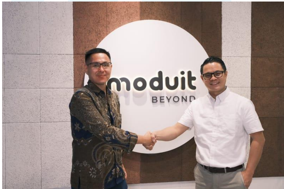
Gambar 2.7 Dokumentasi peluncuran Advisory Academy

Layanan MOSAIC merupakan fitur dimana pengguna diberikan arahan oleh advisor yang terintegrasi sebagai penasihat investasi. Untuk menunjang kebutuhan para pengguna, Moduit memastikan MOSAIC berisi oleh advisor yang berkualitas dan berpengalaman, oleh karena itu moduit menyediakan layanan Advisory Academy agar pengguna tidak ragu dalam berinvestasi menggunakan Moduit. Program Advisory Academy bertujuan melatih advisor baru yang berlisensi untuk melayani kebutuhan investasi masyarakat, terutama generasi muda.