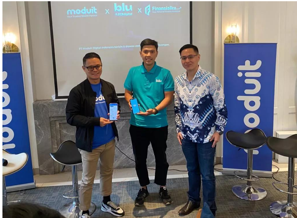
Gambar 2.6 Dokumentasi Kolaborasi Moduit dan PT Finansialku

Moduit menjalin kemitraan dengan PT Solusi Finansialku Indonesia (Finansialku.com). Kerja sama ini berfokus pada edukasi keuangan dan distribusi produk investasi kepada generasi milenial dan Gen Z , yang merupakan segmen pasar potensial di dunia investasi. Melalui program Advisory Academy, kedua pihak juga mengembangkan pelatihan bagi calon penasihat investasi. Kerja sama ini bertujuan membantu masyarakat memahami cara memilih produk keuangan yang tepat untuk mencapai tujuan finansial mereka, serta memberikan edukasi mendalam tentang pentingnya perencanaan keuangan yang baik.