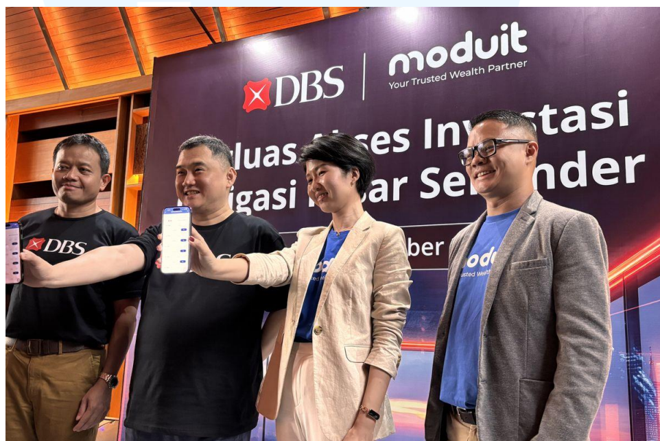
Gambar 2.4 Dokumentasi kolaborasi Moduit dan Bank DBS

Pada 15 Oktober 2024, Moduit berkolaborasi dengan PT Bank DBS Indonesia untuk menawarkan akses ke lebih dari 100 pilihan Obligasi Pasar Sekunder. Kolaborasi ini dilakukan pertama kali di Indonesia di mana sebuah bank bekerja sama dengan platform wealth tech , yang memungkinkan investor untuk membeli obligasi pasar sekunder melalui aplikasi Moduit. Bank DBS Indonesia dan Moduit menargetkan 5.000