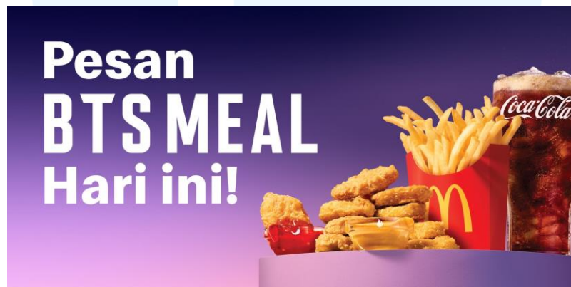
Gambar 2.6 Menu Limited Edition kolaborasi dengan BTS

Pada tanggal 9 Juni 2021, produk kolaborasi McDonald's dengan grup boyband Korea Selatan, Bangtan Boys, atau yang sering dikenal dengan sebutan BTS, rilis di Indonesia dengan nama produk BTS Meal yang berlaku dari tanggal 9 Juni 2021 hingga 10 Juni 2021. BTS Meal terdiri dari 9-10 buah McNuggets, kentang goreng ukuran medium , minuman ukuran medium , dan dipping sauce untuk McNugget dengan rasa sweet chili dan cajun . Tidak hanya dari makanan, namun kemasan yang digunakan untuk kolaborasi ini pun menggunakan desain tersendiri khusus produk BTS Meal, baik dari kemasan McNuggets, minuman, dipping sauce , ataupun paper bag mereka, dengan menggunakan logo dari group BTS, dan warna ungu yang identik dengan BTS itu sendiri.