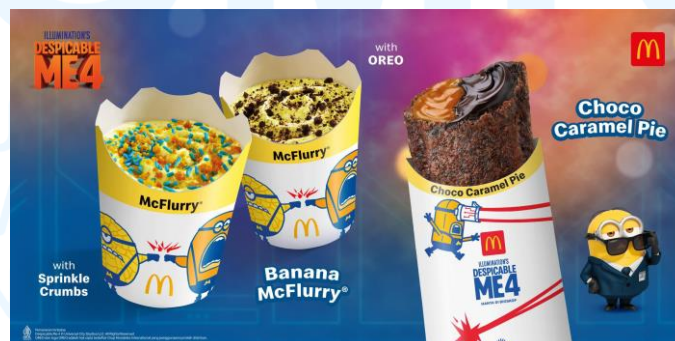
Gambar 2.9 Menu Limited Edition kolaborasi dengan film Despicable Me 4