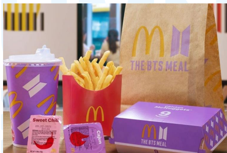
Gambar 2.7 kemasan menu Limited Edition kolaborasi dengan BTS