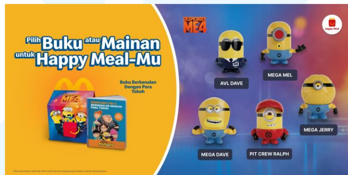
Gambar 2.8 Mainan Happy Meals dari kolaborasi dengan film Despicable Me 4

Pada tanggal 14 Juni 2021, McDonald's Indonesia berkolaborasi dengan film yang cukup terkenal, yang didistribusikan oleh studio Illumination, yaitu Despicable Me 4 . Kampanye yang dirancang oleh pihak McDonald's Indonesia berupa produk mainan Happy Meals dengan karakter Minions yang ikonik yang berlaku hingga tanggal 25 Juli 2024, dan juga menu kolaborasi berupa Banana McFlurry dengan topping Sprinkle Crumbs atau Oreo, dan Choco Caramel Pie yang masih tersedia hingga saat ini. Tidak hanya produk mainan ataupun makanan, kampanye yang dilakukan oleh McDonald's Indonesia juga berupa iklan yang disiarkan pada official YouTube channel McDonald's Indonesia berupa animasi 3D singkat. Selain itu, kemasan yang digunakan untuk produk menu makanan, ataupun kemasan Happy Meals memiliki desain dengan ilustrasi dari Minions , warna yang digunakan pada kemasan merupakan warna kuning dan biru, yang dimana kedua warna tersebut identik dengan karakter-karakter Minions .