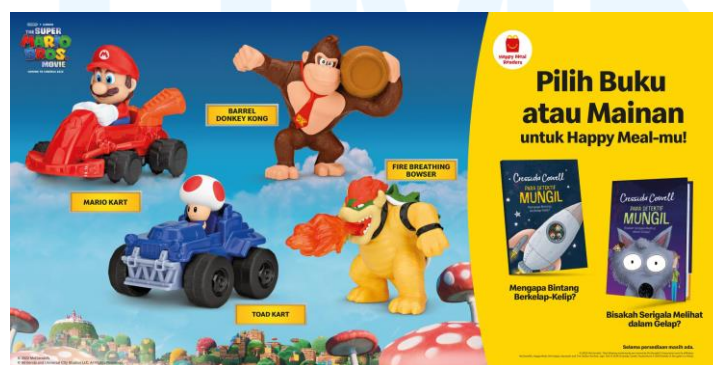
Gambar 2.4 Mainan Happy Meals dari kolaborasi dengan The Super Mario Bros Movie dan buku cerita anak-anak karya Cressida Cowell

Pada tanggal 3 Februari 2023, McDonald's Indonesia melakukan kolaborasi dengan salah satu seri game yang diterbitkan oleh Nintendo, yang akhirnya mendapatkan adaptasi film pada tanggal 5 April 2023, "The Super Mario Bros Movie" yang didistribusikan oleh Universal Pictures, dan buku Petualangan Para Detektif Mungil karya Cressida Cowell, selaku penulis dari film animasi "How to Train Your Dragon" yang didistribusikan oleh DreamWorks Pictures, dalam bentuk mainan produk Happy Meals . Kolaborasi ini berlaku dari tanggal 3 Februari 2023 hingga 16 Maret 2023.