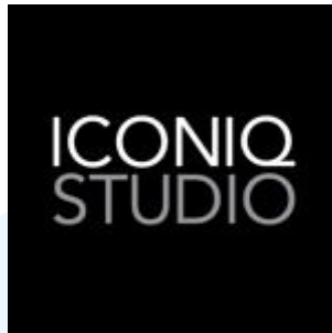
Gambar 2.1 Logo Iconiq Studio