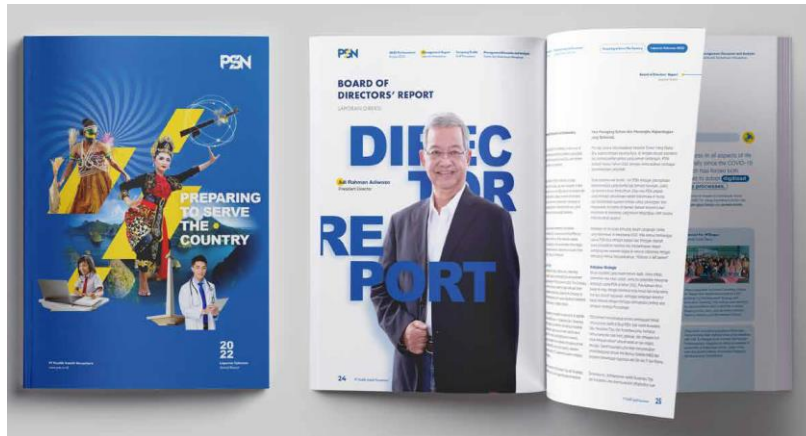
Gambar 2.9 Portofolio Iconiq Studio (PSN)