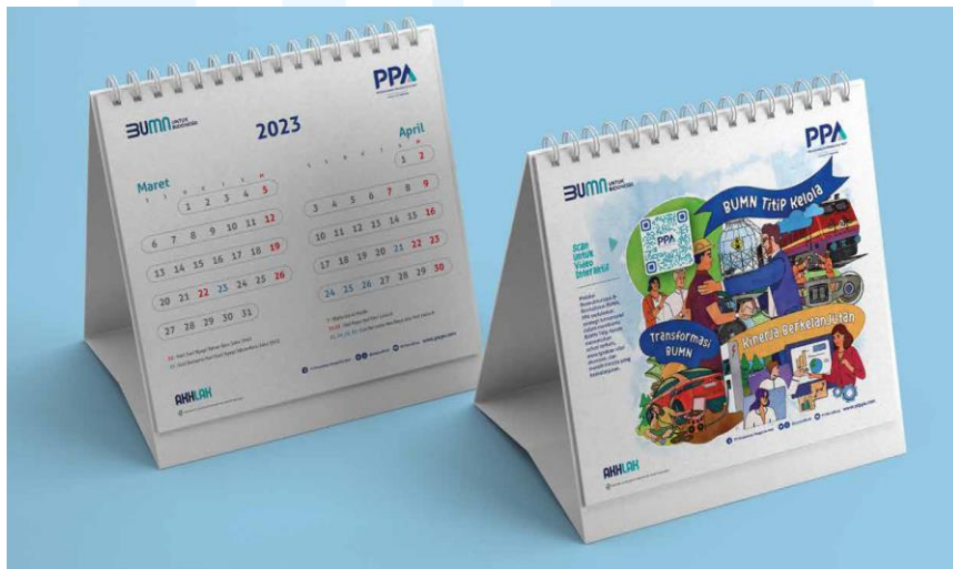
Gambar 2.11 Portofolio Iconiq Studio (PPA)