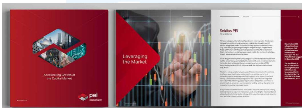
Gambar 2.6 Portofolio Iconiq Studio (PEI)