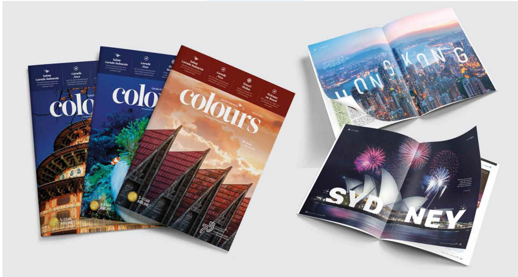
Gambar 2.8 Portofolio Iconiq Studio (Colours)