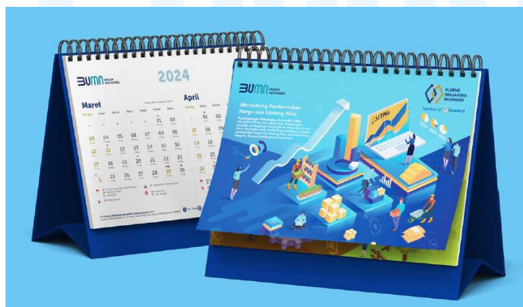
Gambar 2.10 Portofolio Iconiq Studio (KBI)