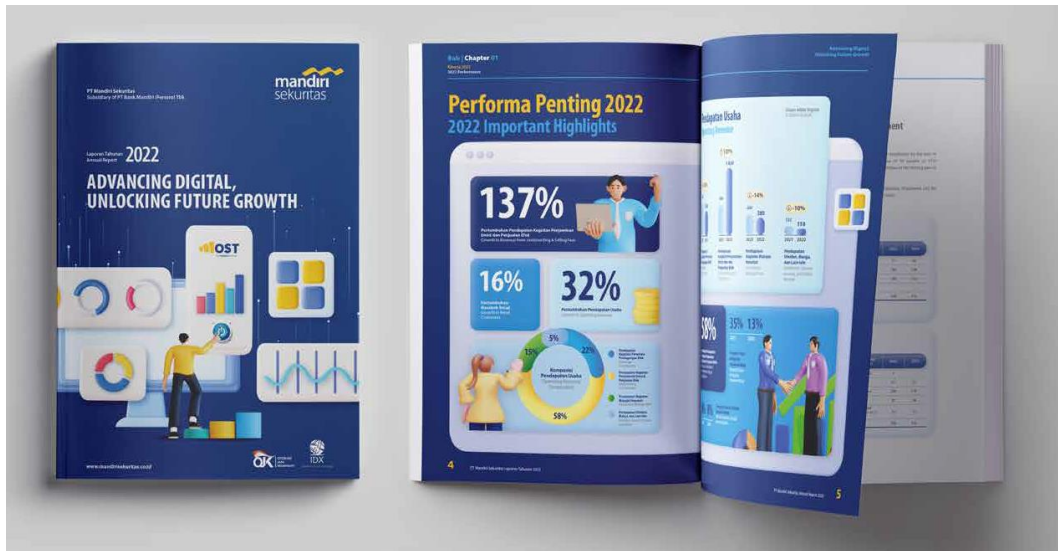
Gambar 2.7 Portofolio Iconiq Studio (Mandiri Sekuritas)