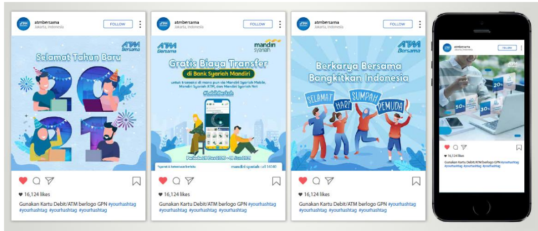
Gambar 2.12 Portofolio Iconiq Studio (ATM Bersama)