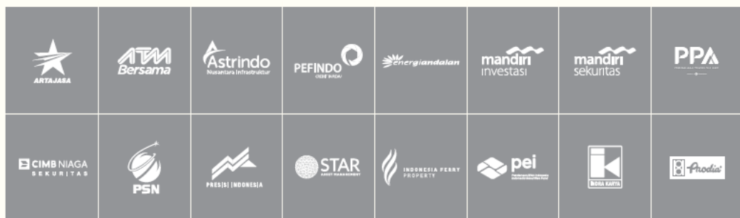
Gambar 2.3 Client Iconiq Studio

Iconiq Studio sudah berdiri sejak tahun 2017 hingga sekarang di dalam setiap tahunnya Iconiq memiliki peningkatan yang cukup signifikan. Memiliki 10 karyawan cukup profesional di setiap divisinya. Sampai saat ini Iconiq sudah memiliki client 16 perusahaan yang bekerja sama dengannya.