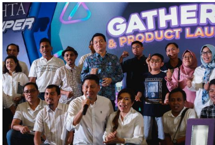
Gambar 2.7 Contoh Gambar Acara Corporate Gathering

Lalu, Little Things juga sering untuk menangani acara corporate gathering . Biasanya perusahaan - perusahaan menggunakan jasa Little Things dalam mengatur jalan acara yang akan mereka adakan mulai dari ulang tahun perusahaan, launching produk, hingga gathering awarding bagi karyawan - karyawan yang mereka miliki. Dalam menangani corporate gathering , Little Things biasanya menyiapkan acara - acara yang seru dan gimik seperti hadiah undian, doorprize , game - game untuk para karyawan, dan acara lainnya yang dapat memeriahkan suatu gathering tersebut.