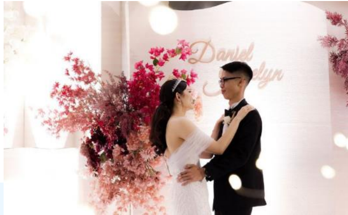
Gambar 2.6 Contoh Gambar Acara Pernikahan

Lalu, Little Things juga sering untuk menangani acara corporate gathering . Biasanya perusahaan - perusahaan menggunakan jasa Little Things dalam mengatur jalan acara yang akan mereka adakan mulai dari ulang tahun perusahaan, launching produk, hingga gathering awarding bagi karyawan - karyawan yang mereka miliki. Dalam menangani corporate gathering , Little Things biasanya menyiapkan acara - acara yang seru dan gimik seperti hadiah undian, doorprize , game - game untuk para karyawan, dan acara lainnya yang dapat memeriahkan suatu gathering tersebut.