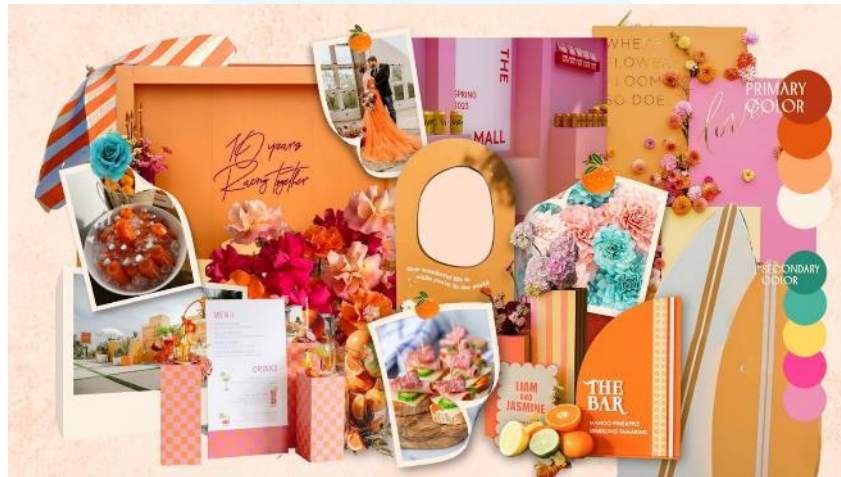
Gambar 2.4 Contoh Moodboard Little Things

ditentukan, Little Things akan membuat moodboard agar segala aspek mulai dari dekor, dresscode, hingga makanan yang disediakan sesuai dengan konsep acara yang telah ditentukan bersama. Berikut ini adalah salah satu contoh dari moodboard yang dibuat oleh Little Things.