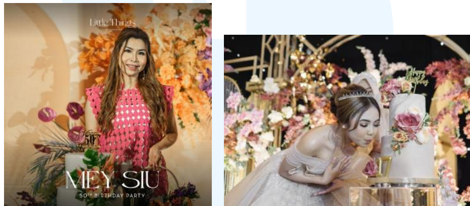
Gambar 2.8 Contoh Gambar Acara Ulang Tahun (kiri) Gambar 2.9 Contoh Gambar Acara Sweet Seventeen (kanan)

Terakhir adalah acara ulang tahun. Kebanyakan klien yang menggunakan jasa ini adalah seorang remaja yang ingin mengadakan pesta ulang tahun sweet seventeen yang biasanya dirayakan dengan acara perayaan yang besar. Namun, tidak menutup kemungkinan acara ulang tahun lainnya seperti acara ulang tahun yang ke 50, ataupun acara ulang tahun lainnya. Sama seperti jasa - jasa yang disediakan Little Things, Little Things akan membantu para klien dalam segala proses dari pemilihan konsep, pemilihan vendor, budgeting, hingga event organizing di hari pesta berlangsung.