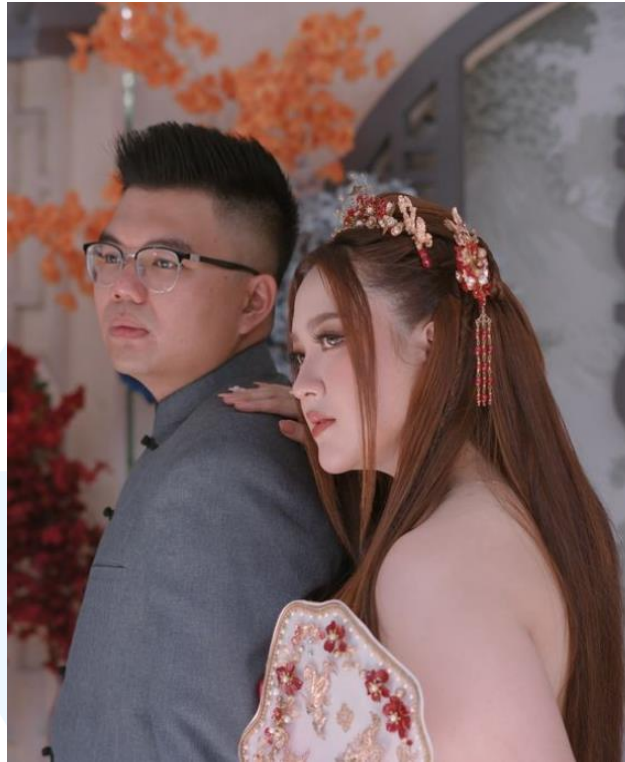
Gambar 2.5 Contoh Gambar Acara Lamaran

Berikutnya, Little Things juga melayani untuk prosesia acara resepsi pernikahan. Biasanya orang mengambil 1 paket yaitu prosesi ting jing dan resepsi sehingga konsep yang sudah dibuat tetap konsisten disegala acara yang mereka inginkan. Pada acara pernikahan, Little Things juga akan membantu mulai dari persiapan sebelum acara seperti budgeting, pemilihan vendor, dan penentuan venue, hingga acara berlangsung. Little Things akan mengerahkan anggota crewnya untuk memastikan acara pernikahan ini berlangsung dengan baik dan lancar. Crew yang dikerahkan memiliki tugasnya masing - masing sesuai dengan divisinya.