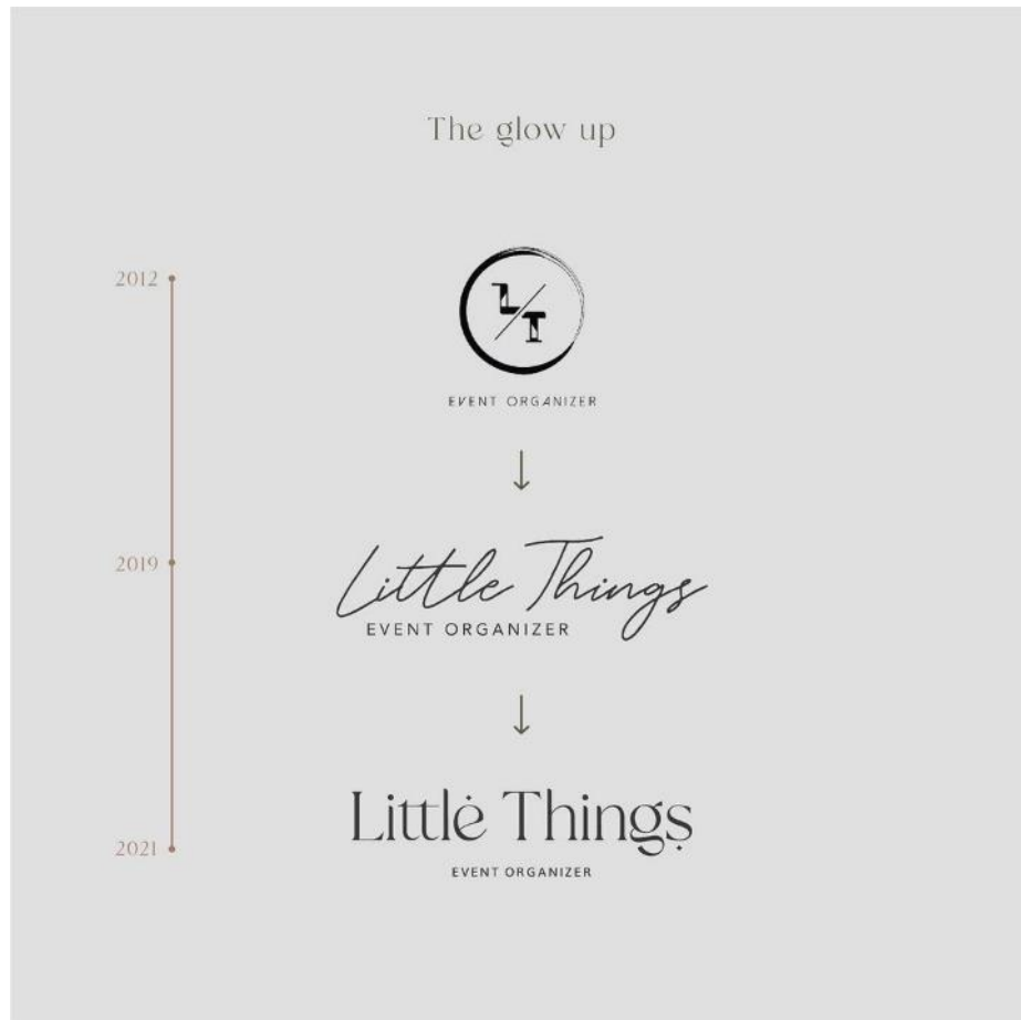
Gambar 2.2 Perkembangan Logo Little Things

Things berekspansi menjadi korporat juga. Hal ini ditujukan agar logo Little Things menjadi logo yang proper dan cocok untuk di kalangan manapun.