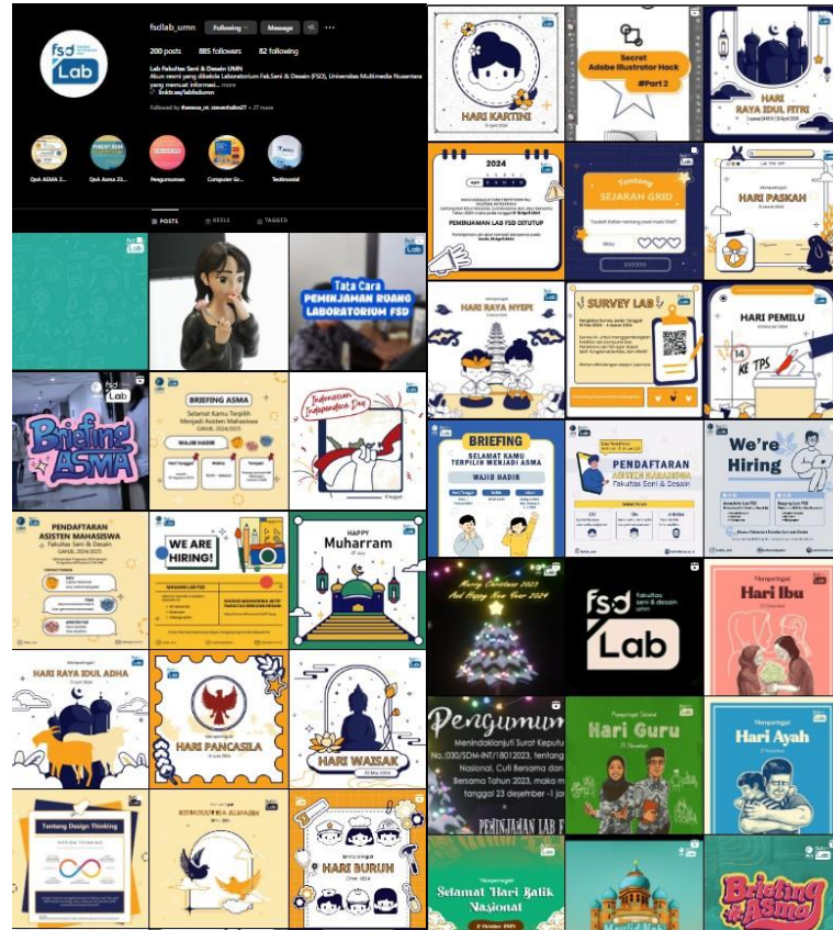
Gambar 2.3 Instagram Lab FSD UMN

asisten mahasiswa, dan poster perayaan hari raya tertentu di unggah di Instagram Lab FSD UMN.