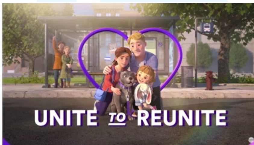
Gambar 2.3 Portofolio Perusahaan “ My Ruff Day ”

SuperPixel merasa terhormat atas kesempatan bekerja sama dengan Petco untuk memproduksi film pendek animasi My Ruff Day . Film ini menceritakan anjing yang terpisah dari keluarganya. Anjing tersebut pada akhirnya dapat dipertemukan lagi dengan keluarganya melalui platform Love Lost . Film ini bertujuan untuk meningkatkan jumlah reuni antara hewan peliharaan yang hilang dan mengajak keluarga mereka menggunakan database nasional gratis untuk hewan peliharaan yang hilang.