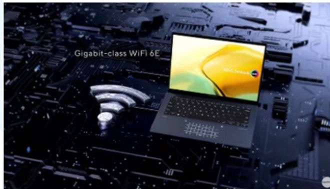
Gambar 2.6 Portofolio Perusahaan “Asus Zenbook 14 OLED UX3402”

Superpixel juga pernah bekerjasama dengan brand terkenal, yaitu Asus untuk mempromosikan produk baru mereka. Animasi film hanya berdurasi 14 detik. Superpixel membuat animasi 3D untuk mempromosikan produk laptop Zenbook 14 OLED terkait dengan spesifikasi kinerja CPU yang baik dan kelebihan yang dapat berubah menjadi tablet . Dalam proyek ini, Superpixel menangani seluruh proses dari tahap pra-produksi hingga pasca-produksi. Mulai dari pembuatan ide, storyboard , pembuatan model 3D, animasi, hingga compositing .