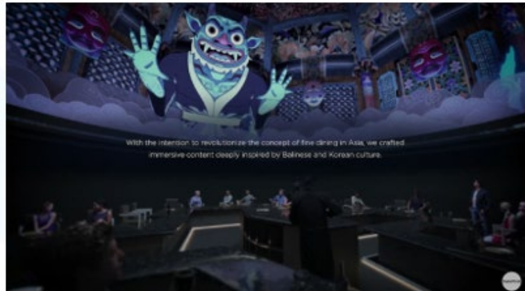
Gambar 2.7 Portofolio Perusahaan “Dome Projection”