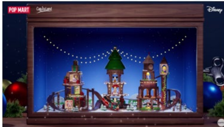
Gambar 2.4 Portofolio Perusahaan “ Capitaland - Christmas 2023 ”