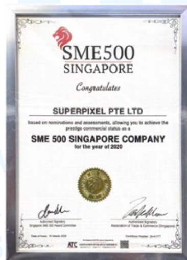
Gambar 2.8 Penghargaan SME500

Superpixel juga mendapatkan penghargaan SME500 pada tahun 2020-2021 berkat kemampuannya dalam menciptakan solusi kreatif yang fleksibel untuk klien industrinya. Penghargaan ini menjelaskan komitmen Superpixel dalam menciptakan konten berkualitas yang selalu relevan dengan kebutuhan klien dan menginspirasi. Penghargaan ini juga menunjukkan kemampuan Superpixel yang dapat memuaskan permintaan klien-klien besar seperti TikTok dan ASUS serta mampu beradaptasi terhadap kebutuhan pasar yang dinamis.