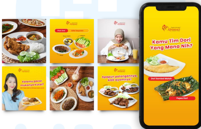
Gambar 2.5 Desain Feeds dan IG Story Ayam Goreng Karawaci

Ayam Goreng Karawaci adalah usaha kuliner yang populer di Indonesia, khususnya di daerah Karawaci, Tangerang. PT Mitra Kreasi Asia (Firstpage) memegang peran untuk mengelola Social Media Marketing & Management untuk Ayam Goreng Karawaci. Elemen visual pada konten yang dihasilkan berupa fotografi produk makanan Ayam Goreng Karawaci dan desain grafis yang menarik sesuai dengan brand identity Ayam Goreng Karawaci.