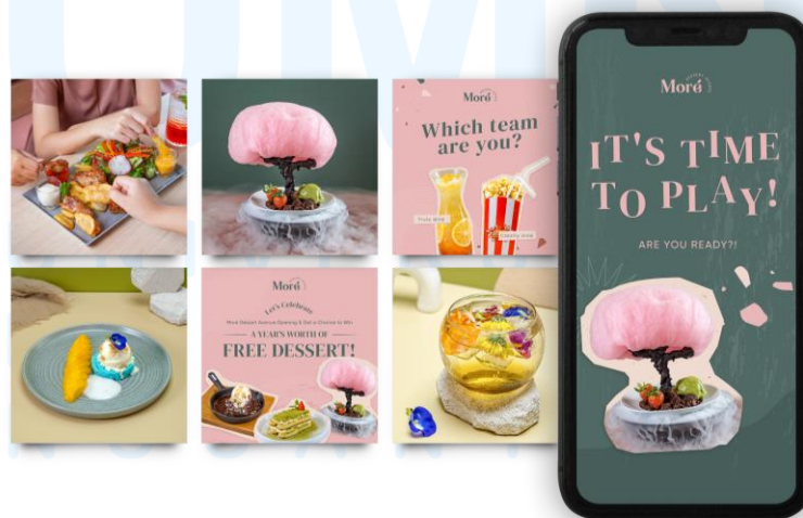
Gambar 2.7 Desain Feeds dan IG Story More Dessert Avenue

More Dessert Avenue merupakan sebuah kafe yang menawarkan beragam pilihan dessert lezat, seperti kue, es krim, dan dessert khas lainnya. PT Mitra Kreasi Asia (Firstpage) mengelola Social Media Marketing & Management untuk More Dessert Avenue. Konsep desain yang dibuat memberikan kesan modern dan playful dengan elemen visual yaitu fotografi produk yang menarik, serta warna pastel yaitu pink dan hijau yang memberikan kesan manis dan ceria.