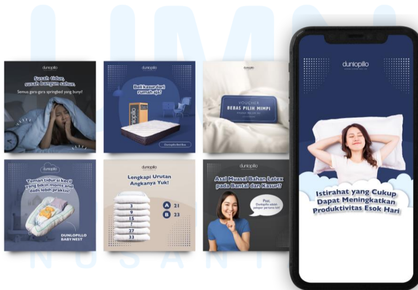
Gambar 2.4 Desain Feeds dan IG Story Dunlopillo

Dunlopillo adalah brand yang berfokus pada penyediaan produk tidur berkualitas tinggi, seperti kasur, bantal, dan perlengkapan tidur lainnya. PT Mitra Kreasi Asia (Firstpage) mengelola Social Media Marketing & Management untuk Dunlopillo. Berikut merupakan tampilan desain feeds dan Instagram story yang telah dibuat.