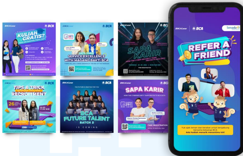
Gambar 2.3 Content Creation BCA