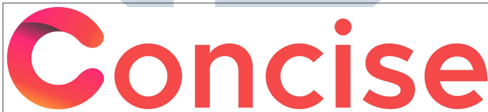
Gambar 2.1. Logo perusahaan PT Ganda Visi Jayatama

Berdasarkan hasil wawancara yang dilakukan terhadap salah satu karyawan pada Lampiran 7, perusahaan ini adalah perusahaan IT Consultant yang berada di Ruko Crystal No. 19 Gading Serpong yang telah berdiri sekitar tahun 2021. Saat ini, perusahaan telah memiliki kurang lebih 20 karyawan baik itu karyawan tetap, karyawan kontrak maupun karyawan magang. Dulunya, perusahaan ini berada di Ruko Golden 8 Blok K No.25 dan kini telah berkembang dengan pesat. Per tahun 2024, terdapat beberapa project yang telah dikerjakan oleh PT Ganda Visi Jayatama, diantaranya adalah Legal TINA, Kecap Ingeris, Home Mart, Spectacle, Company Profile PMI, hingga Company Profile Habco. Logo PT Ganda Visi Jayatama dapat dilihat pada Gambar 2.1.