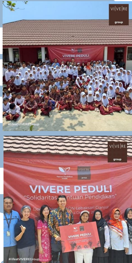
Gambar 3. 3 VIVERE for Education