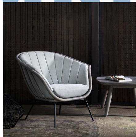
Gambar 3. 5 Good Design Indonesia Award 2017