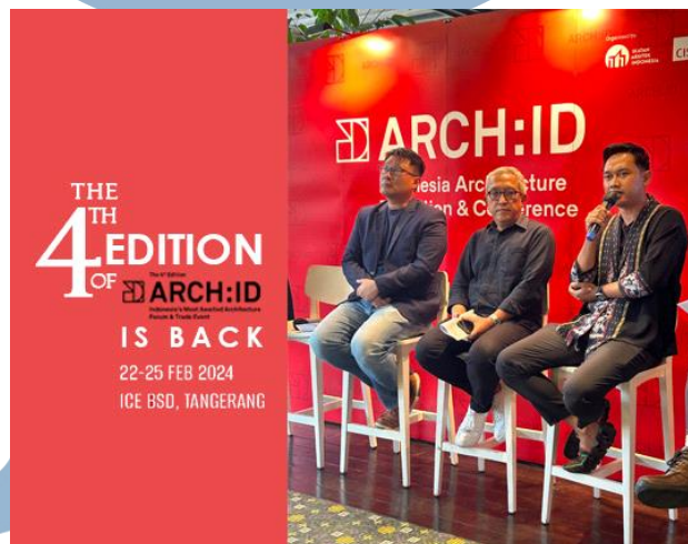
Gambar 3. 6 ARCH:ID 2024