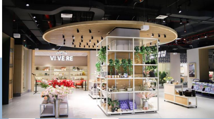
Gambar 3. 4 Lokal by VIVERE