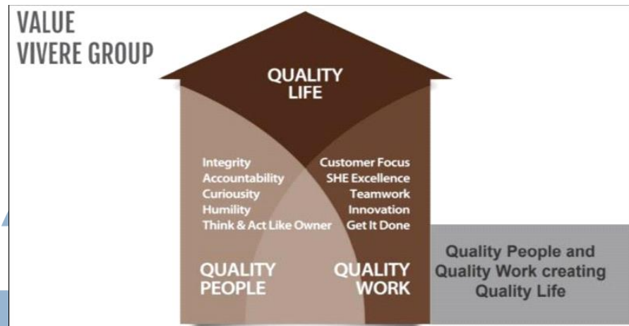
Gambar 2. 2 Value VIVERE Group