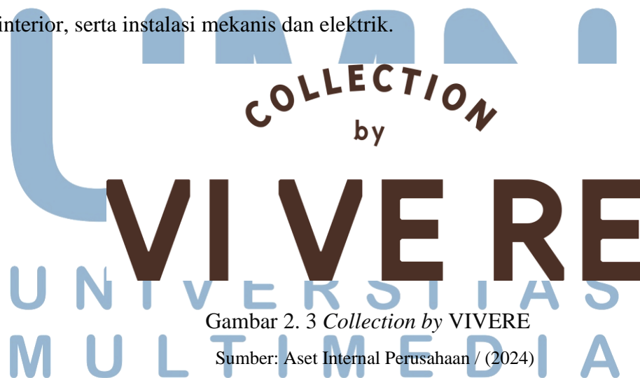
Gambar 2. 3 Collection by VIVERE

Dari seluruh unit bisnis yang ada di PT VMK, dua terbesar adalah Collection By VIVERE & IDEMU. Dengan lebih mendetail, VIVERE terhubung secara efektif melalui SAP Business All-in-One, sebuah sistem perangkat lunak ERP (Enterprise Resource Planning) . Elemen tambahan dari grup ini menawarkan solusi komprehensif untuk berbagai kebutuhan proyek, mulai dari perabotan standar hingga yang dirancang khusus, perlengkapan interior, serta instalasi mekanis dan elektrik.