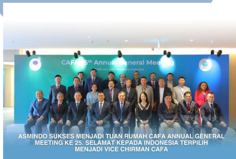
Gambar 3. 7 Council of Asian Furniture Association (CAFA) 25th Annual Meeting