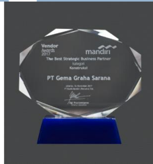
Gambar 3. 1 Mandiri Vendor Award 2017

Sumber: https://www.ggs-interior.com/en/about/awards/ / (2022)