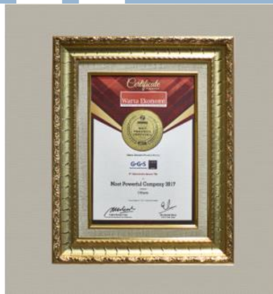
Gambar 3. 2 Indonesia Most Powerful Companies Award (IMPCA) 2017