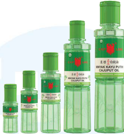
Gambar 2.4 Minyak Kayu Putih

Produk yang paling populer dan dikenal banyak oleh masyarakat Indonesia tentunya adalah Minyak Kayu Putih. Produk ini menerima award Top Brand dan ICESA 2017 (Indonesia Customer Satisfaction Award). Terdiri dari 100% Cajuput Oil (Minyak Kayu Putih), bisa membantu menghangatkan tubuh, menenangkan demam, mengurangi gatal-gatal gigitan nyamuk, dan sebagai alternatif jika mual. Minyak Kayu Putih tersedia dalam 5 size yaitu 15, 30, 60, 120, dan 210 ml.