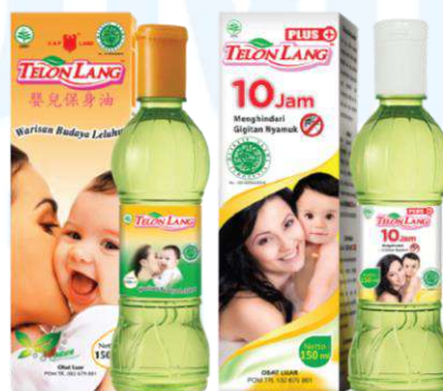
Gambar 2.7 Minyak Telon Lang & Telon Lang Plus