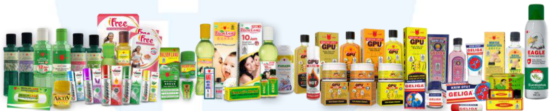
Gambar 2.3 Parade Produk Cap Lang

Saat ini, Cap Lang sudah mendistribusikan jutaan produknya di Indonesia dan juga di lebih dari 30 negara di dunia seperti Singapura, Malaysia, Brunei, Vietnam, Saudi Arabia, Bahrain, Kamboja, Timor Leste, Afrika dan masih banyak lagi. Contoh produk yang didistribusikan antara lain seperti Minyak Kayu Putih, Minyak Kayu Putih Plus, Minyak Eucalyptus Aromatherapy, Telon Lang, Telon Lang Plus, Geliga Balm, Geliga Krim, GPU Krim, Minyak Gandapura, MAMO, VFresh, Fresh On, GPU Oil, Inhaler Lang, Citronella Oil, Balsem Lang, Yellow Aktiv Balm, Minyak Angin Lang, Bedak Purasil, Minyak Otot Geliga, Norit, Pil Sakit Perut, Eagle Disinfectant Spray, dan IFree. Ada beberapa produk unggulan yang digemari banyak masyarakat terutama masyarakat Indonesia sebagai berikut: