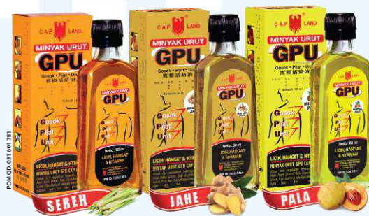
Gambar 2.6 GPU