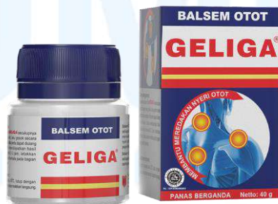
Gambar 2.5 Balsem Geliga

Produk ini merupakan sebuah balsem yang digunakan untuk pegal-pegal dengan teknologi repeated heat yang memberikan sensasi panas yang berulang selama 6 jam. Sama dengan Minyak Kayu Putih, produk ini menerima beberapa