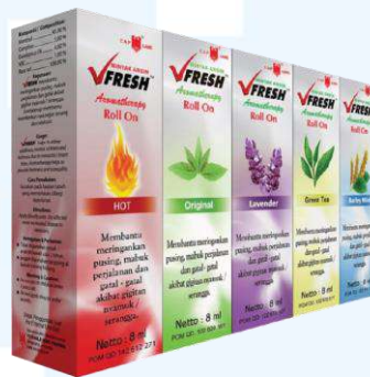
Gambar 2.8 Vfresh Roll On