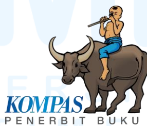
Gambar 2.2 Logo Penerbit Buku Kompas

Seiring berjalannya waktu, Kompas Gramedia terus berkembang dan melakukan diversifikasi bisnis. Pada tahun 1970, Penerbit Buku Kompas didirikan dengan tujuan untuk memenuhi kebutuhan masyarakat akan buku-buku berkualitas (P. Cahandar, wawancara pribadi, September 2024). Penerbit ini kemudian menjadi salah satu penerbit buku terbesar di Indonesia, menghasilkan berbagai jenis buku mulai dari buku pelajaran hingga buku umum.