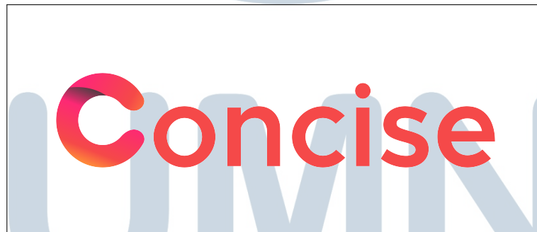
Gambar 2.1. Logo perusahaan PT Ganda Visi Jayatama

PT Ganda Visi Jayatama atau yang lebih dikenal sebagai Concise didirikan pada tahun 2022 sebagai perusahaan startup di bidang IT Consultant. Dalam waktu singkat, perusahaan ini telah menunjukkan perkembangan pesat, dengan jumlah karyawan yang kini melebihi 20 orang dari berbagai divisi. Logo perusahaan Concise dapat dilihat pada Gambar 2.1. PT Ganda Visi Jayatama telah berhasil menyelesaikan beberapa proyek penting, termasuk Legal TINA, Spectacle, Kecap Inggris, Home Mart, PMI Company Profile, dan Habco Company Profile. Saat ini, perusahaan sedang mengerjakan sejumlah proyek baru seperti Habco MRO Apps, Enigma, Laurensius Prodiakon, dan lainnya, yang mencerminkan komitmennya dalam menyediakan solusi teknologi informasi yang inovatif dan berkualitas bagi para klien. Awalnya berlokasi di Ruko Golden 8 Blok K No. 25, perusahaan ini kini, setelah 2 tahun beroperasi, beralamat di Ruko Crystal No. 19, Gading Serpong.