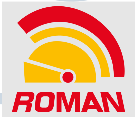
Gambar 2.1. Logo Roman Ceramics