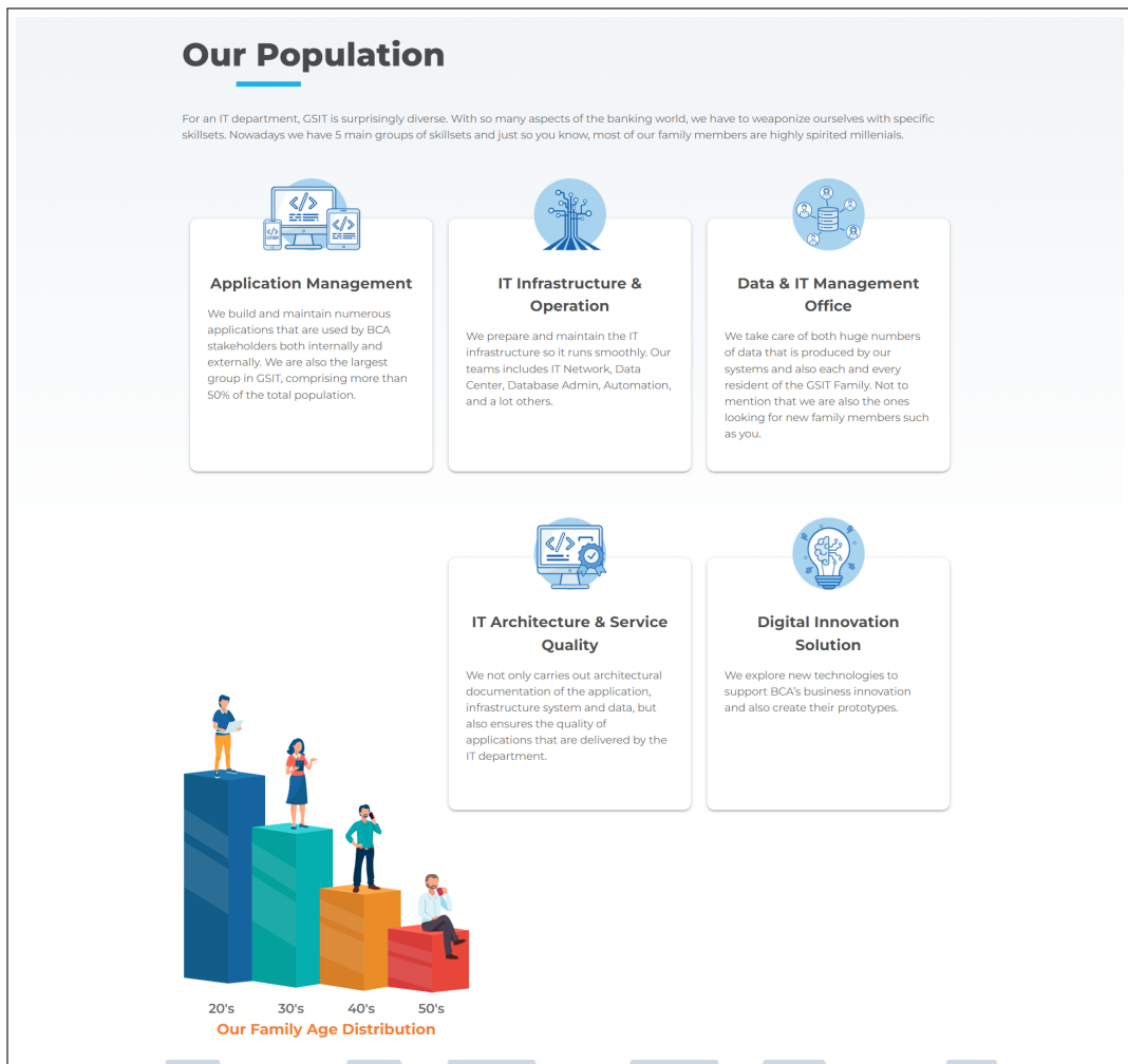
Gambar 2.3. Struktur Sub Divisi Group Strategic Information Technology