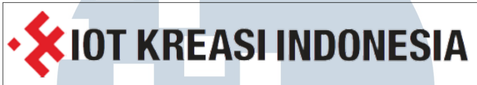
Gambar 2.1. Logo perusahaan [2]