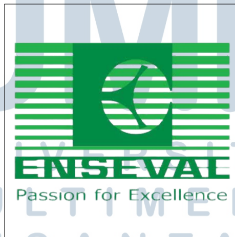
Gambar 2.1. Logo PT Enseval Putera Megatrading

Seiring dengan perkembangan perekonomian di Indonesia, PT Enseval memperluas usahanya ke berbagai bidang di luar perdagangan dan distribusi. Pada tahun 1993, terjadi pengalihan seluruh kegiatan distribusi dan perdagangan ke PT Arya Gupta Cempaka. Selanjutnya pada 6 Agustus 1993, PT Enseval mengganti namanya menjadi PT Enseval Putera Megatrading. Pada 1 Agustus 1994, PT Enseval Putera Megatrading Tbk. tercatat di Bursa Efek Jakarta [7].