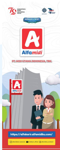
Gambar 2.4 Poster X-Banner Alfamidi KemnakerFest