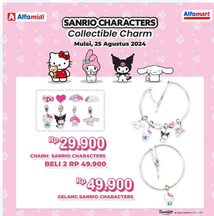
Gambar 2.3 Flyer Promo Kolaborasi Alfamidi x Sanrio

Kolaborasi dengan Sanrio Characters di tahun 2024 tersebut berupa berbagai macam collectible charm berbentuk karakter Sanrio seperti Hello Kitty, My Melody, Kuromi, dan Cinnamoroll yang dipasang pada gelang yang juga disediakan pada setiap gerai toko Alfamidi.