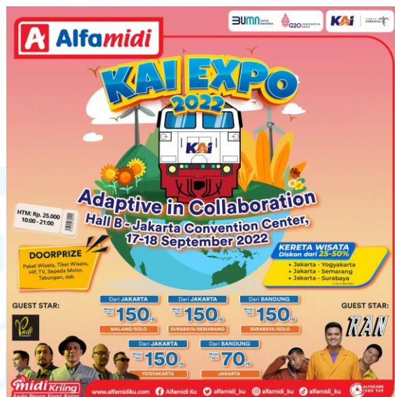
Gambar 2.5 Flyer Promo Kolaborasi Alfamidi dengan KAI Expo

Kolaborasi dengan KAI Expo di tahun 2022 merupakan kolaborasi adaptif yang menghadirkan sebuah promo spesial dari Alfamidi dengan memberikan diskon 25-50% pada tiket kereta wisata dari kota Jakarta ke kota tujuan Yogyakarta, Semarang, dan Surabaya.