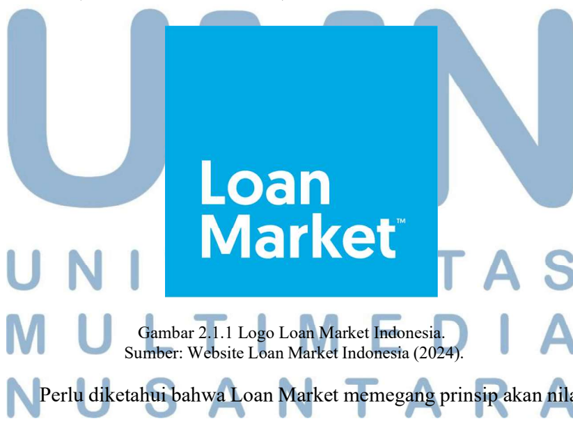
Gambar 2.1.1 Logo Loan Market Indonesia.

Secara umum, Loan Market yang merupakan sebuah bisnis keluarga yang berfokus pada produk - produk bidang pendanaan dan solusi akan permasalahan keuangan, yang dimana dengan harapan agar properti idaman calon debitur nasabah dapat tercapai melalui jasa spesialis keuangan yang ditawarkan (Loanmarket.co.id, 2024).