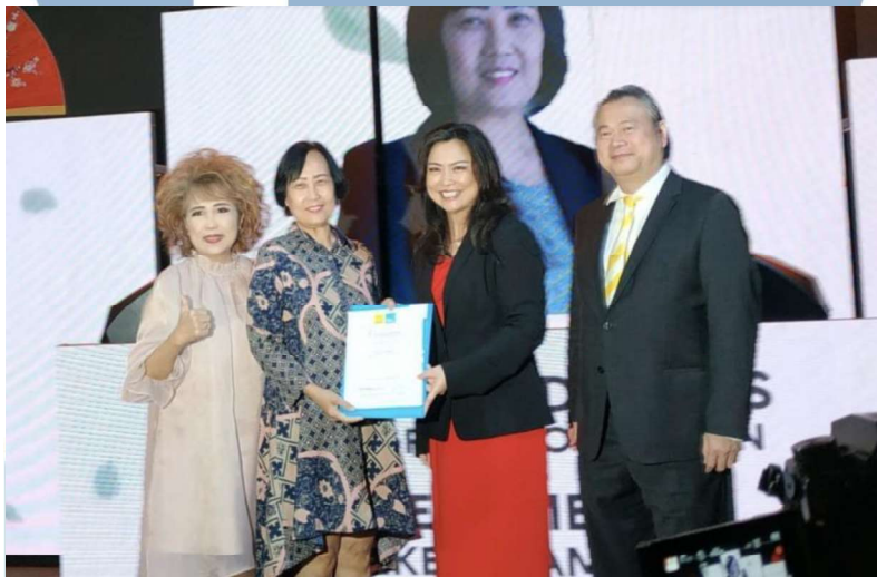
Gambar 2.2 PPC Annual Award 2023 di PIK, Jakarta.

pada tahun selanjutnya tentu Loan Market Alam Sutera memenangkan kembali sertifikat penghargaan lainnya yang merupakan momen penting dalam sejarah perusahaan. Seperti pada (Alamsutera.loanmarket.co.id, 2019) yaitu “Annual Awards 2021: 3rd Winner Top Office Based on Unit” pada tahun 2021 dan piagam lainnya pada tahun 2022, yakni “Annual Awards 2022: 3rd Winner Top Office Based on Unit”, dan “Biannual Awards 2022: 3rd Winner Top Office Based on Gross Comission” serta “Annual Awards 2023: 2nd Winner Top Office Based on Unit” pada tahun lalu yakni 2023. Secara kesimpulan, karena tingkat penjualan komisi bruto dan unit yang meningkat secara positif maka menyebabkan Loan Market Alam Sutera mendapatkan komisi yang tinggi hingga dapat terpilih untuk menjadi kandidat pemenang (Alamsutera.loanmarket.co.id, 2023).