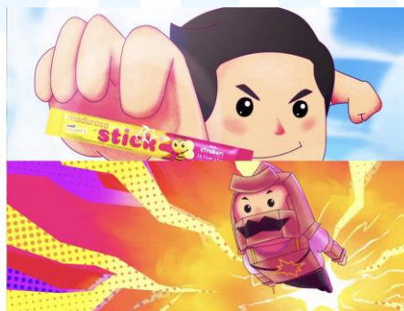
Gambar 2.4 Madurasa Stick x Kesatria Dewa Gatot Kaca