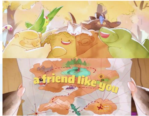
Gambar 2.3 Furriiends

Furriiends merupakan Intellectual Property milik Latrust Animation dan terdiri dari tujuh karakter hewan. IP ini dibuat untuk proyek kolaborasi antara Christabel Annora dan Latrust Animation. IP ini bertujuan menceritakan cerita yang menyentuh hati mengenai persahabatan yang beragam. Visual yang digunakan bertujuan membuat musik yang dipilih menjadi lebih hidup dan membuat audiens merasa terhubung dengan pesan yang disampaikan. Dalam animasi ini, Latrust Animation menyampaikan ceritanya melalui motion graphic dan mengangkat permasalahan sehari-hari dengan ending antiklimaks dan menggemaskan.