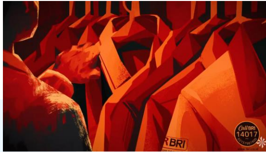
Gambar 2.6 Sadar Nurani – Direktorat Bisnis Mikro BRI

Sadari Nurani merupakan animasi dua dimensi yang dibuat pada tahun 2022 untuk Bank Rakyat Indonesia dan agency Idenyaflux. Animasi ini berjenis motion graphic dan menceritakan tentang pejabat BRI yang tidak peduli dengan masa depan BRI yaitu penurunan ekonomi. Sadari Nurani dibuat dengan tujuan membangkitkan hati nurani BRI sehingga menjadi orang yang tanggung jawab untuk masa depan BRI.