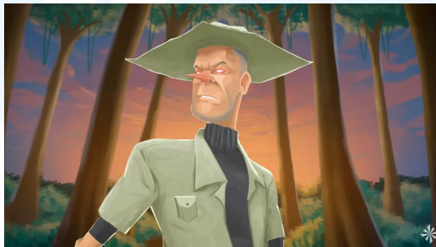
Gambar 2.5 Anak-Anak Hutan

Anak-Anak Hutan merupakan animasi kolaborasi bersama Pagi Tadi. Lagu yang digunakan merupakan album ke-3 milik Pagi Tadi. Lagu dan animasi ini menceritakan tentang seekor singa bernama Rimba yang menjadi korban perdagangan hewan gelap. Animasi ini bersifat dua dimensi (2D), menggunakan teknik frame-by-frame , dan motion graphic dengan artstyle bertekstur lukisan. Animasi ini didedikasikan untuk margasatwa dan alam Indonesia.