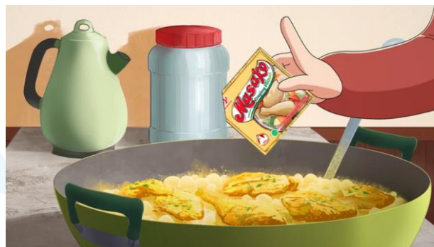
Gambar 2.7 Ajinomoto – Hangatnya Dapur, Hangatnya Keluarga

Hangatnya Dapur Hangatnya Keluarga merupakan animasi yang dibuat untuk Ajinomoto. Animasi ini diciptakan untuk liburan Idul Fitri dan menunjukkan liburan ini melalui memasak di dapur. Pesan yang ingin disampaikan merupakan suasana dan kehangatan di rumah bersama keluarga