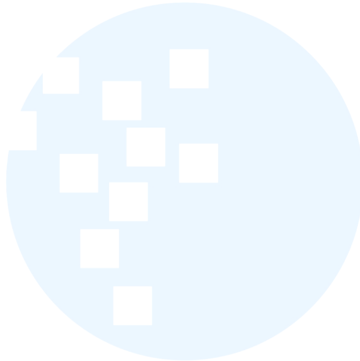
Gambar 3.54 Hasil Seamless Pattern Watercolor Abstract ..... 49