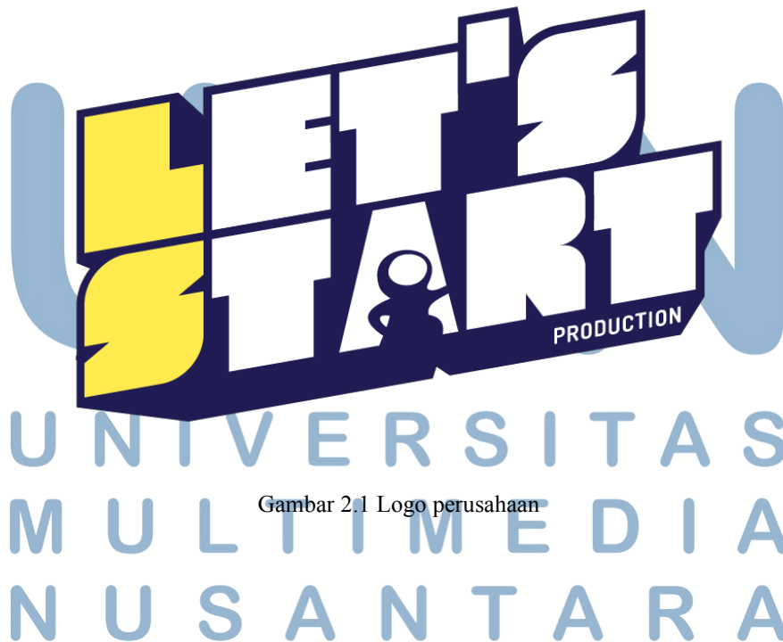
Gambar 2.1 Logo perusahaan

Let's Start Production adalah sebuah production house yang bergerak dalam industri kreatif. Let's Start Production dapat membantu dalam menyediakan media promosi dan informasi bagi perusahaan, institusi dan bidang usaha.