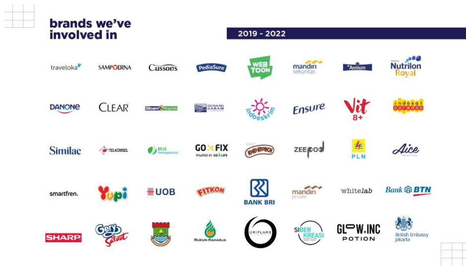
Gambar 2.4 Brand yang telah bekerja sama

Berikut ini adalah beberapa hasil karya yang telah dikerjakan oleh Let's Start Production