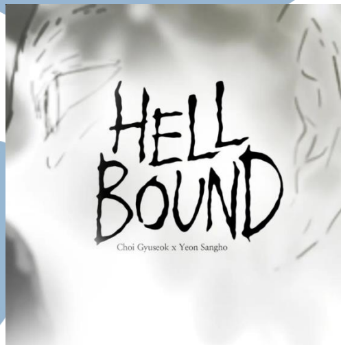
Gambar 2.5 Motion graphic komik webtoon Hell Bound

Proyek ini adalah sebuah Motion graphic dari Webtoon Hellbound yang digunakan sebagai video trailer. Video trailer ini digunakan sebagai media promosi dan iklan. Semua proses dalam produksi video trailer ini termasuk pembuatan konsep visual, storyboard , ilustrasi 2D, animasi motion , compositing , voice over dan