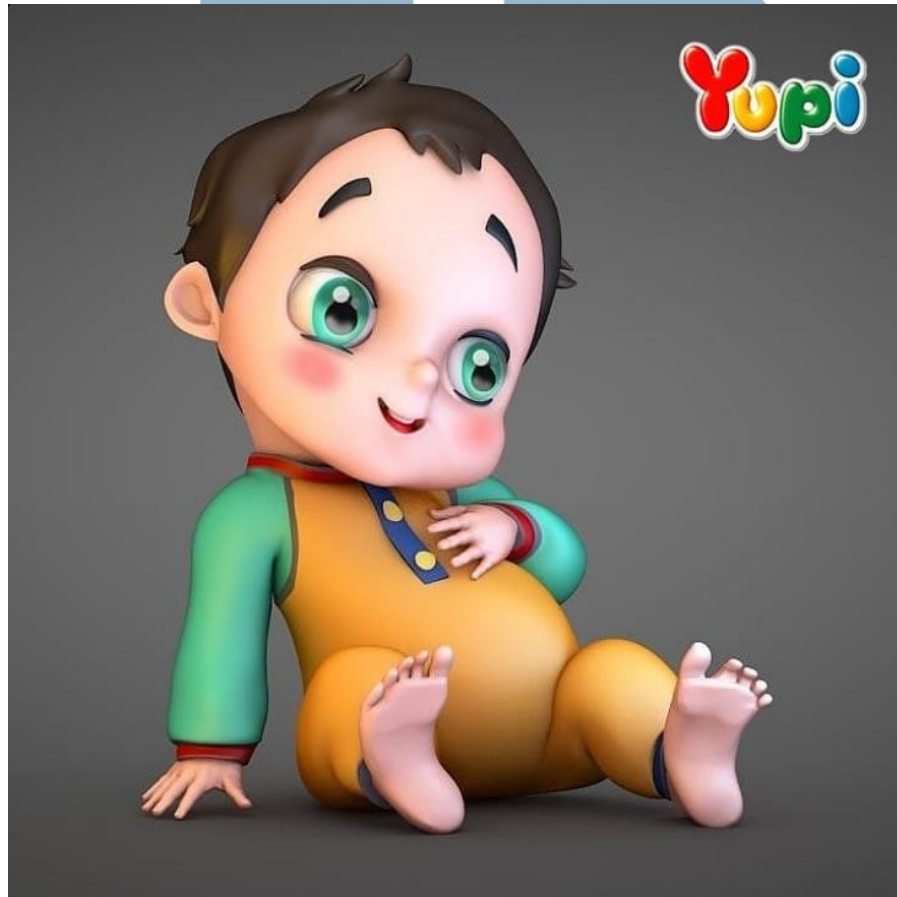
Gambar 2.6 3D karakter yupi

Yupi merupakan perusahaan permen yang memproduksi berbagai permen jelly dan gummy . Pada proyek ini Let's Start Production berkolaborasi dengan brand Yupi dalam pembuatan beberapa 3D karakter.