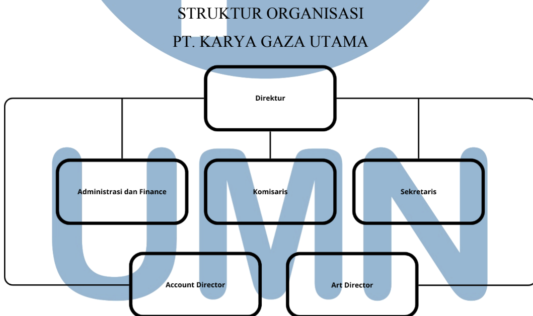
Gambar 2.3 Bagan Struktur Organisasi Perusahaan

Berikut ini adalah struktur organisasi Let's Start Production yang di antaranya, Direktur sebagai pemimpin tertinggi, kemudian di bawahnya terdapat Administrasi dan Finance yang mengurus pada bagian keuangan, Komisaris dan Sekretaris. Dan pada bagian kreatif terdapat Account Director dan Art Director .