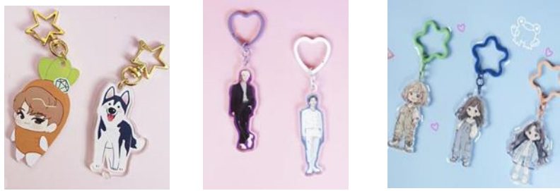
Gambar 2.6 Produk Gantungan Kunci Instaprint