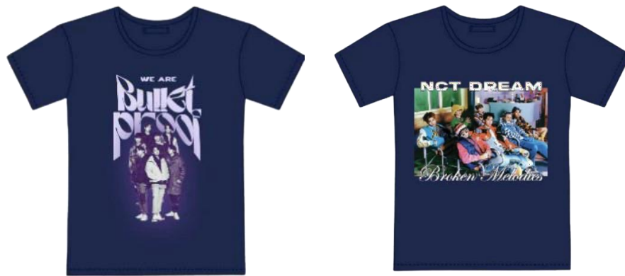
Gambar 2.4 Produk T-shirt Instaprint

Instaprint juga memperluas fokusnya dibidang Fashion , khususnya dengan menawarkan layanan percetakan T-shirt yang ditujukan untuk segmen anak muda. Layanan ini dibuat untuk memenuhi kebutuhan generasi muda yang memiliki kreativitas tinggi dan ingin mengekspresikan diri mereka melalui desain pakaian yang unik. Tim Upmosphere telah mengikuti tren pada industri hiburan untuk menjadikannya sebagai referensi desain T-shirt , serta dijadikan contoh Template pada Marketplace Instaprint . Pelanggan diberikan diberikan kepuasan penuh untuk mengaplikasikan desain sesuai dengan keinginannya, selain itu pelanggan juga bisa memilih warna dan ukuran T-shirt sesuai dengan keinginan.