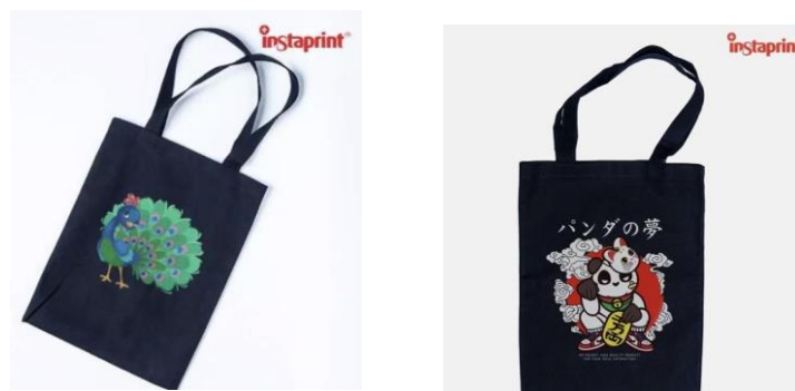
Gambar 2.3 Produk Totebag Instaprint

Instaprint menawarkan produk unggulan berupa Totebag yang dapat dikostumisasi oleh pelanggan sesuai dengan desain yang diinginkan. Desain dari Totebag itu sendiri merupakan karya dari tim Upmosphere dengan tampilan yang memberi kesan trendy untuk anak muda. Fitur Custom Design memberikan kebebasan bagi pelanggan untuk mengekspresikan kreativitas mereka, sehingga Totebag menjadi unik dan spesial.