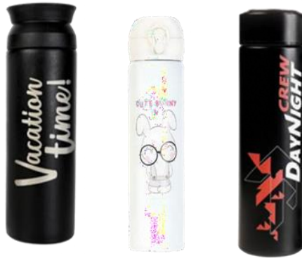
Gambar 2.5 Produk Tumbler Instaprint

membuat desain produk Tumbler dengan konsep model kekinian dengan tujuan menyesuaikan segmentasi anak muda yang gemar mengoleksi Tumbler , membawanya ke kantor atau kuliah.