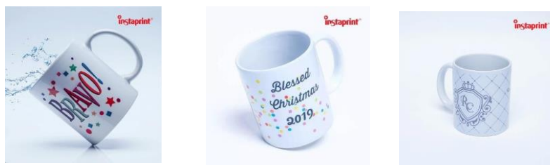
Gambar 2.7 Produk Mug Instaprint

Tim Upmosphere juga membantu dalam mendesain produk Mug yang diproduksi dan dijual oleh Instaprint . Instaprint menawarkan produk Mug atau cangkir yang dapat digunakan untuk berbagai keperluan, baik untuk kebutuhan rumah tangga, Merchandise perusahaan, dan keperluan lainnya. Produk Mug Instaprint memiliki berbagai pilihan desain yang dapat disesuaikan dengan kebutuhan pelanggan, misalnya untuk promosi perusahaan, bisa juga sebagai hadiah perpisahan, atau menjadi alat perabotan dirumah. Keunggulan dari produk ini adalah dapat dikostumisasi oleh pelanggan sesuai dengan desain pribadi yang diinginkan.