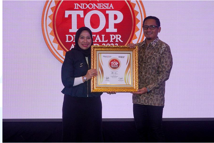
Gambar 2.7 Top Digital Public Relations 2023

harapan agar para pembeli mendapatkan referensi dan gambaran mengenai produk mobil yang ditawarkan Perusahaan.