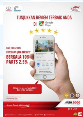
Gambar 2.3 Poster Review Toyota Google Maps

Beberapa portfolio karya yang pernah dihasilkan perusahaan Auto 2000 yaitu berupa karya poster, spanduk. Pada salah satu karya poster yang berjudul “Poster Review Toyota Google Maps” ini merupakan hasil karya dari salah satu mahasiswa yang pernah menjalani magang di Perusahaan Auto 2000 cabang BSD.