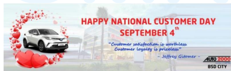
Gambar 2.4 Spanduk Happy National Customer Day

Desain poster tersebut dibuat dengan tujuan mengajak para calon pembeli untuk memberikan review atau ulasan mengenai pengalaman melakukan pembelian atau melakukan servis mobil di Auto 2000 dengan kesempatan mendapatkan promo jasa service berkala yang ditawarkan perusahaan. Dalam poster tersebut terdapat elemen gambar berupa tangan yang menggenggam handphone dengan gambar ulasan perusahaan Auto 2000 pada Google Maps.