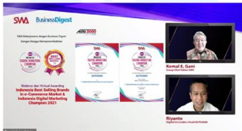
Gambar 2.5 Digital marketing Champion (2021)

Karya spanduk yang berjudul “ Happy National Customer Day ” merupakan hasil karya dari salah satu mahasiswa yang pernah menjalani magang di Perusahaan Auto 2000 cabang BSD. Spanduk tersebut dibuat dalam rangka memperingati Hari Pelanggan Nasional setiap tanggal 4 September. Dalam desain spanduk tersebut menggunakan elemen gambar mobil Toyota, elemen bentuk love dan gambar Gedung Perusahaan Auto 2000. Pembuatan spanduk ini juga dilakukan untuk menghargai para pembeli khususnya yang telah melakukan pembelian dan rutin menggunakan jasa servis mobil Auto 2000.