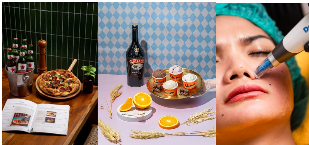
Gambar 2.3 Portofolio Aitimedia brand Livingstone, Udders, Fangeline

Berikut beberapa karya foto pilihan dari Aitimedia Jakarta: