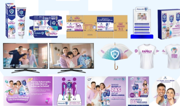
Gambar 2.6 Formula Family

Promosi ATL mencakup iklan TV (TVC) untuk menjangkau audiens lebih luas, yang kemudian disebarluaskan melalui media digital lain seperti Instagram dan YouTube . Promosi BTL meliputi media seperti poster, merchandise, rak pajang di toko, wobbler , papan nama toko (PNT), serta sampling produk di lokasi-lokasi strategis. Selain itu, Formula Family juga menyelenggarakan program promosi khusus untuk keluarga guna meningkatkan kesadaran dan minat konsumen terhadap produk ini. Untuk lebih jelasnya, berikut adalah gambar tampilan design collateral untuk produk Formula Family .