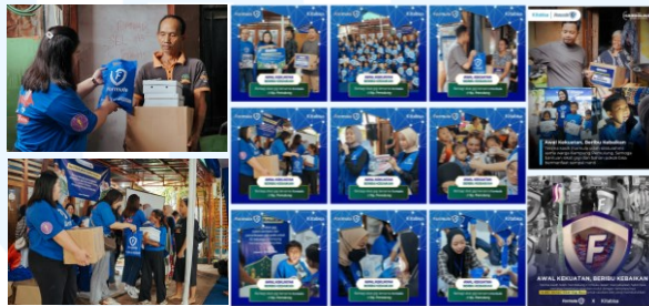
Gambar 2.9 Formula x Kitabisa

Gambar 2.9 adalah dokumentasi dari kampanye berbagi kebaikan yang diadakan oleh Formula. Formula mengadakan kampanye berbagi kebaikan dengan mengumpulkan sikat gigi bekas dari beberapa titik terpilih, di mana setiap satu sikat gigi bekas yang terkumpul akan dikonversikan menjadi satu sikat gigi baru. Kampanye ini akan berujung pada aktivitas bakti sosial di Kampung Pemulung, Jakarta Selatan, pada tanggal 25 Mei 2024. Formula bekerja sama dengan Kitabisa.com untuk memastikan acara tersebut sukses dan memberikan manfaat yang nyata bagi masyarakat.