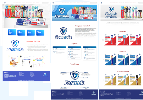
Gambar 2.5 Official Website Formula ( https://www.formula.id/ )

kegiatan serta aktivitas yang dijalankan Formula, memberikan gambaran tentang kontribusi Formula terhadap masyarakat. Berikut ini adalah gambar dari tampilan official website Formula secara umum.