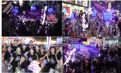
Gambar 2.7 Parade Launching Produk Formula Glowow di PRJ

Jakarta (PRJ) 2024. Dalam acara tersebut, Formula memberikan pengalaman interaktif kepada para pengunjung yang datang dengan membagikan 3.500 pcs produk secara gratis.