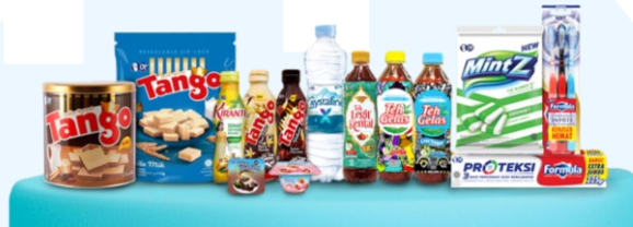
Gambar 2.2 Produk Orang Tua Group

berbagai negara. Selain itu, dengan terus berfokus pada kebutuhan konsumen serta berinovasi secara konsisten, Orang Tua Group telah menghadirkan produk-produk unggulan yang diakui dan mendapatkan penghargaan dari berbagai lembaga survei baik nasional maupun internasional. Berikut adalah gambar yang menunjukkan beberapa produk Orang Tua Group .