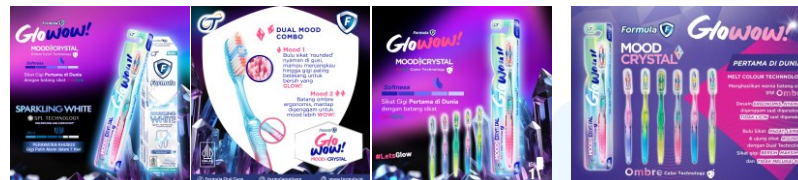
Gambar 2.8 Produk Formula Glowow

Strategi ini tidak hanya berfungsi sebagai langkah promosi, tetapi juga bertujuan untuk memperkenalkan manfaat dan keunggulan Formula Glowow kepada generasi muda secara langsung. Pendekatan ini sekaligus memperkuat keterlibatan merek dengan konsumen melalui pengalaman yang menyenangkan dan berkesan. Selain melakukan penjualannya secara offline di PRJ, Formula Glowow juga dapat ditemukan di online store Tokopedia.