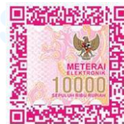
(Sherene Chavia Naomi)