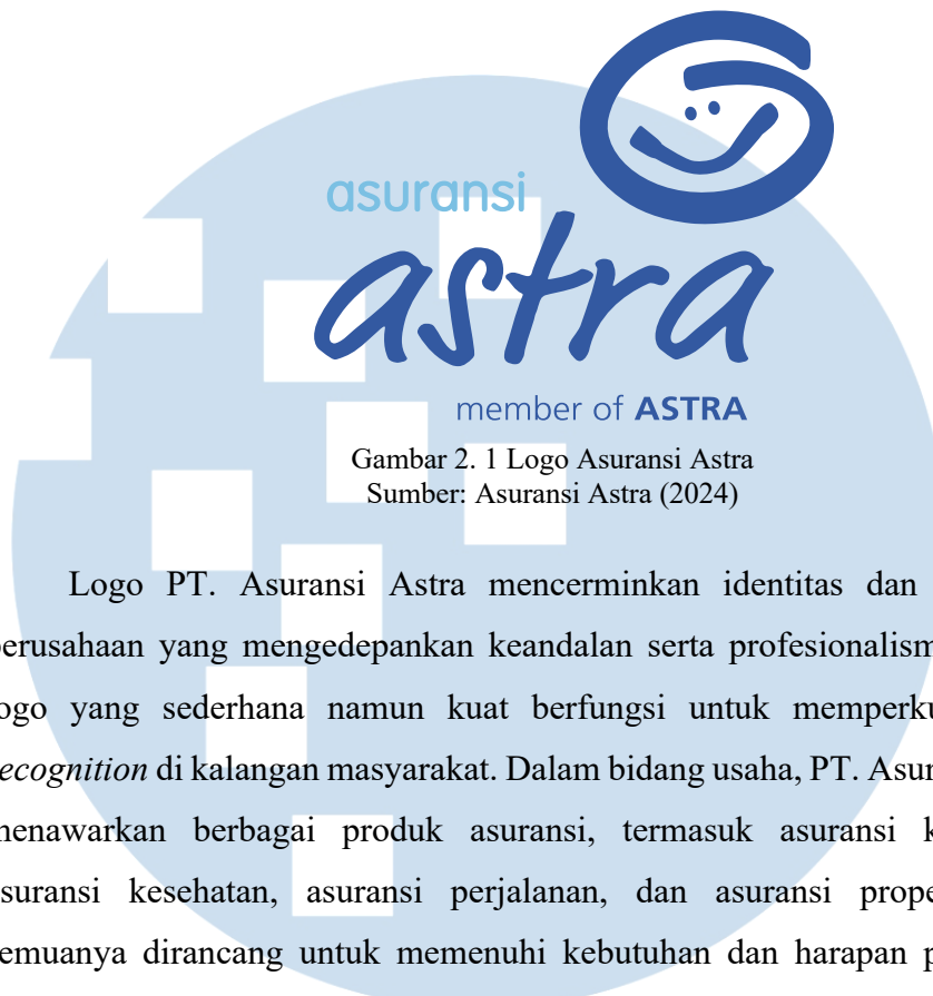
Gambar 2. 1 Logo Asuransi Astra

Logo PT. Asuransi Astra mencerminkan identitas dan nilai-nilai perusahaan yang mengedepankan keandalan serta profesionalisme. Desain logo yang sederhana namun kuat berfungsi untuk memperkuat brand recognition di kalangan masyarakat. Dalam bidang usaha, PT. Asuransi Astra menawarkan berbagai produk asuransi, termasuk asuransi kendaraan, asuransi kesehatan, asuransi perjalanan, dan asuransi properti, yang semuanya dirancang untuk memenuhi kebutuhan dan harapan pelanggan. Produk-produk ini dilengkapi dengan layanan pelanggan yang responsif dan inovatif, memastikan bahwa setiap klaim dan pertanyaan ditangani dengan efisien dan profesional.