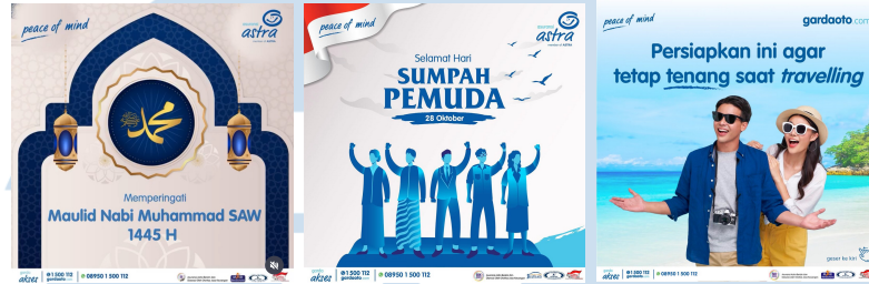
Gambar 2. 7 Portofolio Perusahaan

kesehatan untuk memastikan pelanggan mendapatkan layanan terbaik saat mereka membutuhkannya.