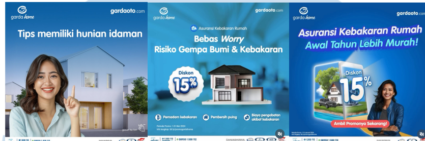
Gambar 2. 5 Portofolio Perusahaan

kenyamanan bagi pemilik mobil, sehingga para pengguna asuransi Garda Oto dapat berkendara tanpa khawatir akan risiko yang mungkin terjadi di jalan.