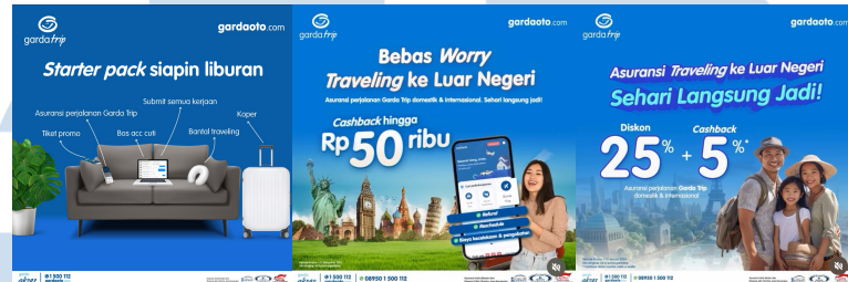
Gambar 2. 3 Portofolio Perusahaan

penulis tentang bagaimana bekerja dalam konteks pemasaran digital dan media sosial pada perusahaan besar seperti PT. Asuransi Astra. Berikut portfolio perusahaan PT. Asuransi Astra yang penulis maksud: