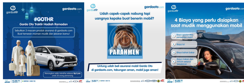
Gambar 2. 4 Portofolio Perusahaan

Garda Trip merupakan salah satu produk asuransi yang ditawarkan oleh Asuransi Astra yang memberikan, ketenangan dan kenyamanan selama bepergian dengan perlindungan menyeluruh terhadap berbagai kemungkinan risiko antara lain, Pembatalan dan Penundaan Perjalanan, Penyakit, Cedera, Kecelakaan, dan Perlindungan Bagasi dan Barang Pribadi. Gardao Trip juga membuat proses pengajuan asuransi perjalanan menjadi sederhana dan nyaman, memungkinkan pelanggan melakukan perjalanan dengan percaya diri, baik untuk perjalanan liburan maupun perjalanan bisnis.