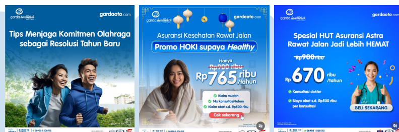
Gambar 2. 6 Portofolio Perusahaan

Garda Home merupakan produk asuransi properti dari Asuransi Astra yang memberikan perlindungan menyeluruh terhadap properti Anda, termasuk kebakaran, bencana alam, pencurian dan berbagai risiko lainnya yang dapat mengancam keamanan properti. Produk ini dirancang untuk memberikan ketenangan dan rasa aman kepada pemilik rumah dengan jaminan perlindungan yang komprehensif. Garda Home membantu pelanggan merasa lebih percaya diri dalam melindungi properti mereka dan menjalani kehidupan sehari-hari tanpa mengkhawatirkan potensi risiko.