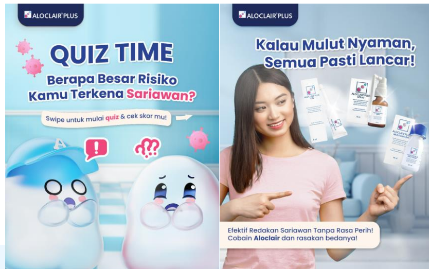
Gambar 2.3.2 Gambar perancangan social media Aloclair Plus

Sebagai merek yang terus berkembang, Aloclair Plus mempercayakan PT. IDEIN KREATIF INDONESIA untuk mengelola media sosialnya. Collaboration ini bertujuan untuk memperkuat kehadiran Aloclair Plus secara digital. PT. IDEIN KREATIF INDONESIA bertanggung jawab dalam membuat strategi media sosial, merancang content plan yang menarik, serta membangun interaksi yang positif dengan para pengikutnya, sehingga Aloclair Plus menjadi pilihan utama dalam kesehatan mulut saat Sariawan.