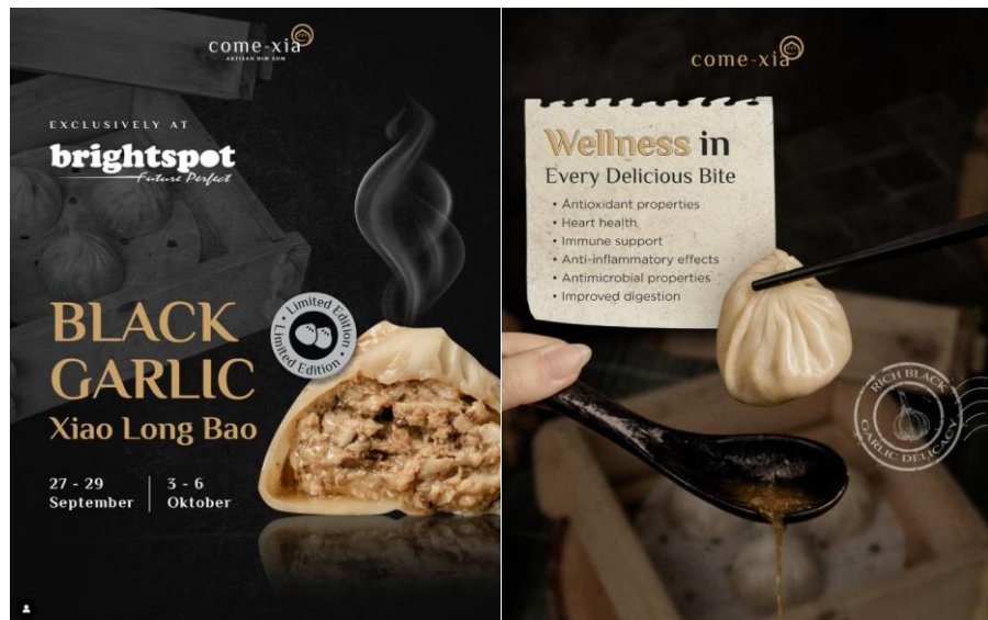
Gambar 2.3.1 Gambar perancangan desain social media Comexia

Comexia adalah restaurant yang memiliki branding yang kuat dan unik. Maka diperlukannya sebuah yang mengatur content sosial media, yang bisa menjadi restaurant unik dengan khas Chinese, maka darai itu, collaboration yang dilakukan PT. IDEIN KREATIF INDONESIA yaitu merancang content plan dan mengatur semua media Instagram comexia dengan identitas dari Comexia yang menggambarkan karakter dari Aroma rasa Comexia.