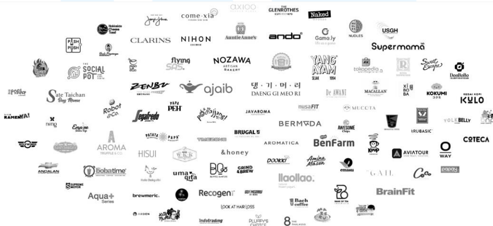
Gambar 2.3 Gambar Client PT. Idein Kreatif Indonesia

PT. IDEIN KREATIF INDONESIA, memiliki portofolio yang beragam dalam menjalin kerja sama dengan berbagai merek terkenal di industri makanan, minuman, kecantikan, hingga gaya hidup. Beberapa brand yang menjadi client perusahaan antara lain Geprek Bensu, Ajaib, Kedai Kopi KULO, Kokumi, Aloclair, Comexia, Umaqita dan Holywings. Perusahaan juga mendukung brand-brand lain seperti The Macallan, Aqua+ Series, dan Tokopedia, dengan layanan kreatif seperti pembuatan content digital, kampanye media sosial, hingga desain visual untuk iklan dan promosi.