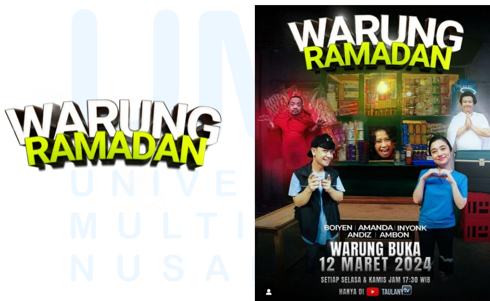
Gambar 2.6 Logo Warung Ramadan/Thumbnail promo

Merupakan sebuah program sketsa yang diproduksi oleh PT. Taulany Media Kreasi untuk menemani masyarakat pada bulan suci Ramadhan yang ditayangkan pada kanal Youtube Taulany TV. Sebuah acara menarik dan bintang tamu yang super seru serta diselingi lelucon para komedian dan pelawak senior.