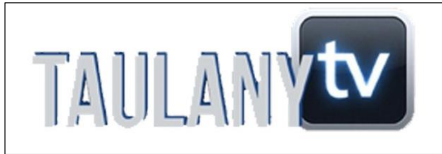
Gambar 2.1 Logo Taulany TV