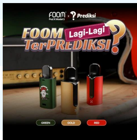
Gambar 2.7 Poster Foom X Prediksi

Merupakan sebuah brand yang dikolaborasikan dengan club motor Prediksi. Produk ini terdiri dari Pods , liquid , gantungan serta sticker yang dapat dibeli di beberapa platform . Pada Pods juga terdapat logo prediksi yang membuat kesan produk semakin digemari oleh banyak orang terutama pada penggemar tim prediksi.