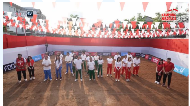
Gambar 2.3 Logo dan tayangan Kampung Merdeka