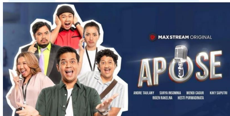
Gambar 2.4 Thumbnail APOSE

Sebuah program yang disponsori oleh MAXSTREAM dan digarap langsung oleh Taulany TV. APOSE sendiri merupakan program sketsa tawa yang diperankan oleh artis/komedian papan atas sehingga sangat mengundang gelak tawa. Program ini merupakan salah satu dari sekian banyak pencapaian yang telah dilalui oleh perusahaan.