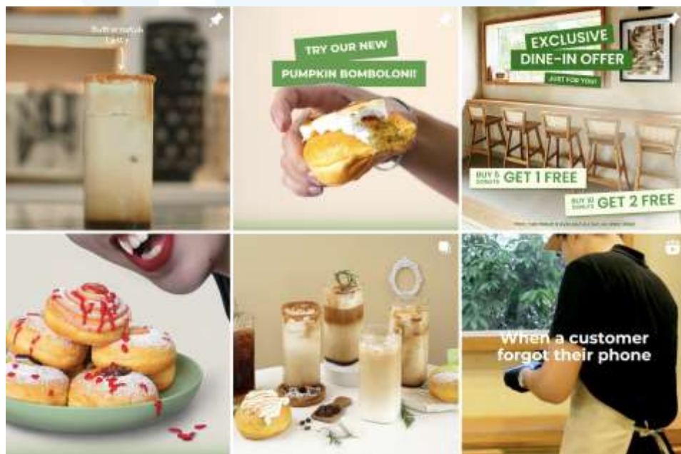
Gambar 2.6 Portofolio Donut Cult

Donut Cult adalah brand di industri F&B yang berfokus pada penjualan donat dengan konsep unik, yaitu menghadirkan dessert manis yang tidak hanya lezat, tetapi juga sehat dan rendah kalori. Saat ini, Donut Cult sedang mengarahkan perhatiannya pada kampanye media sosial untuk memperluas jangkauan dan menarik audiens yang lebih luas. Dengan meningkatnya tren gaya hidup sehat, Donut Cult berupaya menunjukkan bahwa makanan manis tetap bisa dinikmati tanpa rasa bersalah. Melalui konten kreatif di berbagai platform digital, kampanye ini bertujuan untuk mengedukasi konsumen tentang pilihan makanan yang lebih sehat, sekaligus memperkuat brand sebagai penyedia dessert alternatif yang lezat namun tetap menjaga kesehatan.