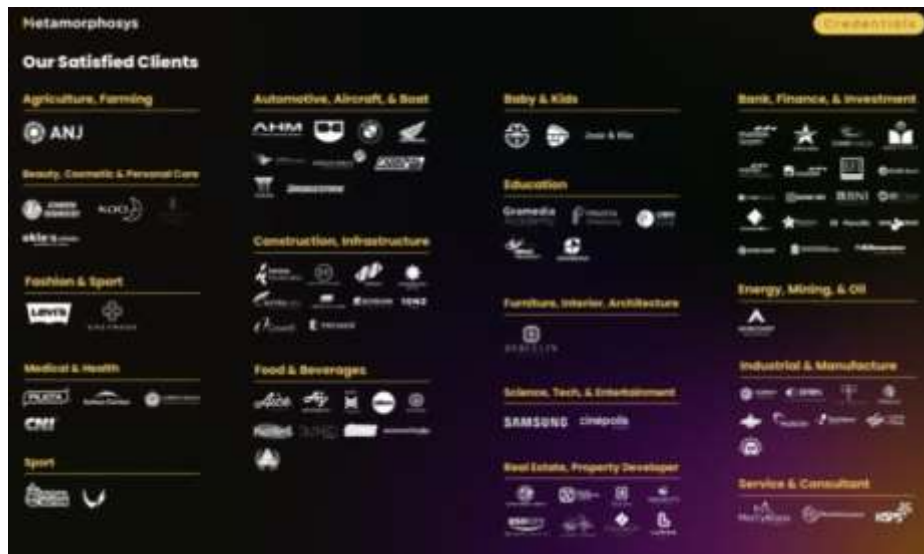
Gambar 2.3 Klien Organisasi Perusahaan

Berikut adalah klien-klien yang sedang dipegang oleh Metamorphosys selama periode penulis magang: