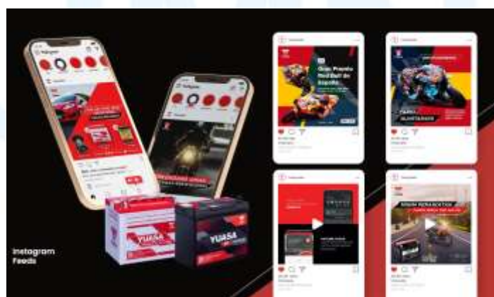
Gambar 2.4 Yuasa Battery Indonesia

Yuasa Battery Indonesia merupakan cabang dari GS Yuasa Corporation, sebuah perusahaan asal Jepang yang terkenal dalam produksi baterai.