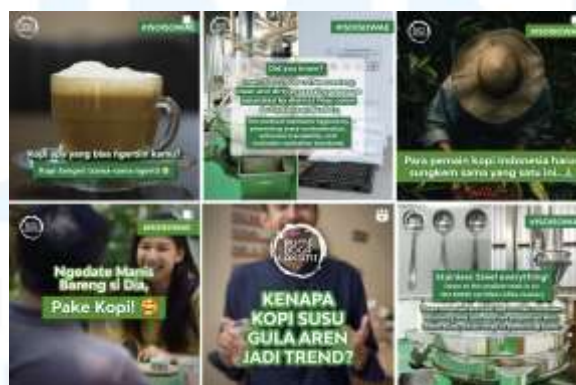
Gambar 2.7 Portofolio BBL

Bumi Boga Laksmi merupakan perusahaan B2B yang berfokus pada produksi dan penjualan kopi berkualitas. BBL telah berada di industri ini cukup lama dan memiliki banyak klien-klien besar. Kopi yang diproduksi oleh BBL merupakan kopi berkualitas tinggi dengan pembuatan yang higienis.