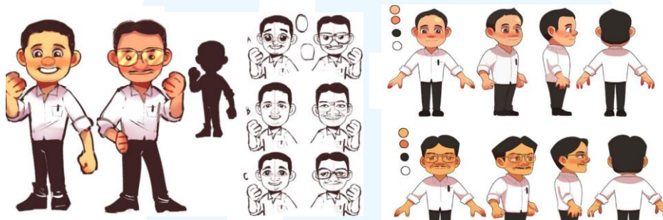
Gambar 2.3.4.1 Desain Walikota dan Wakil Walikota Tangerang