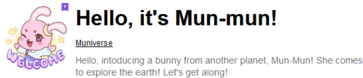
Gambar 2.2.2.1 Salah satu sticker muniverse

tokoh design, environment , dan animasi, serta boardgame Ludo, Ular Tangga, and asset-asset animasi dan komik mengenai Munmun dan Karu.