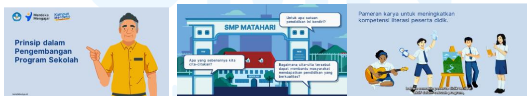
Gambar 2.3.3.1 Thumbnail video Micro learning kemendikbud tipe 2

Ada tiga jenis video yang diproduksi, dan Virtuosity Studio membuat video tipe 2, yang merupakan video live-action atau hybrid yang dibuat menggunakan Motion Graphics. Dalam proyek ini, ada tiga kategori video: Pemodelan Pedagogis (21 video), Program Sekolah yang Berfokus pada Ibu (7 video), dan Komunitas Belajar Siswa yang ada didalam Sekolah (4).