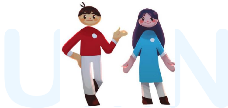
Gambar 2.3.4.2 Desain avatar untuk user umum