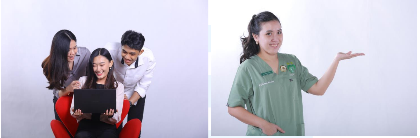
Gambar 2.7 Photoshoot Marketing

ITP juga membantu kegiatan photoshoot untuk marketing fakultas fakultas yang ada di Unika Atma Jaya. Selain itu ITP juga membantu mengarahkan bagaimana pose sekaligus ekspresi wajah agar terlihat menarik dan dinamis.