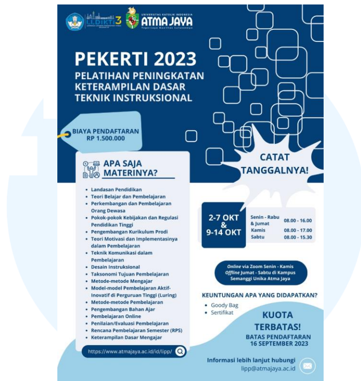
Gambar 2.4 Poster PEKERTI 2023

LIPP mengadakan program PEKERTI pada 2023, PEKERTI sendiri adalah singkatan dari Pelatihan Peningkatan Keterampilan Dasar Teknik Instruksional. Program ini diadakan pada bulan Oktober 2023 lalu dan batas registrasi pada 16 september 2023. Desain dari infografis tersebut mengikuti warna dari logo LLDIKTI itu sendiri dengan penegasan informasi pada bagian tanggal, biaya dan batas akhir pendaftaran.