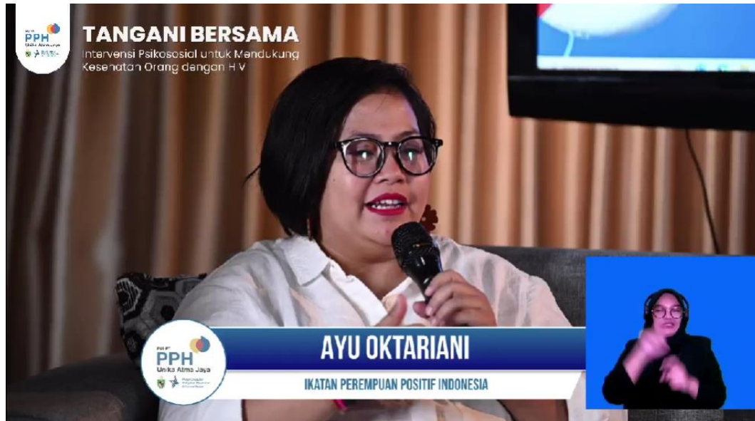
Gambar 2.6 Talk Show PPH

PPH berkoordinasi dengan ITP untuk membuat sebuah Talk Show yang akan disebarakan ke masyarakat luas seperti mahasiswa Unika Atma jaya maupun secara publik dengan membawa topik “Ikatan perempuan positif Indonesia”.