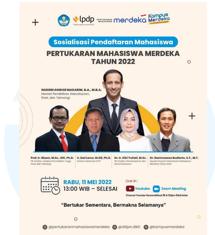
Gambar 2.5 Poster Sosialisasi Kampus Merdeka