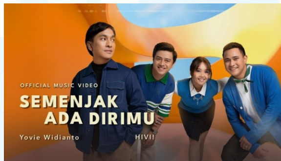
Gambar 2.3.1 Yovie Widianto, HIVI! – Semenjak Ada Dirimu

Dirilis pada 23 Agustus 2024, proyek ini adalah versi remastered dari komposisi Yovie Widianto yang sebelumnya dinyanyikan oleh Andity pada tahun 2007. Tim dari YWMF terlibat mulai dari produksi, pengeditan, hingga menyiapkan berbagai materi desain kolateral untuk mendukung promosi, seperti YouTube thumbnail , Instagram feed , dan Instagram story untuk video musiknya. Adapun YWMF juga menggarap lyric video dari lagu ini yang diunggah seminggu setelah music video -nya keluar.