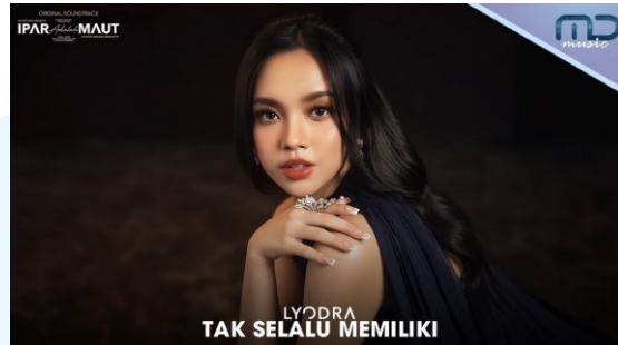
Gambar 2.3.2 Lyodra – Tak Selalu Memiliki

drama keluaran tahun 2024 yang sempat populer karena mengangkat cerita dari sosial media Tiktok.