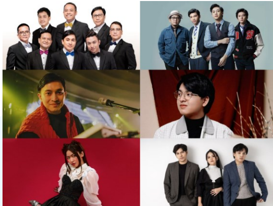
Gambar 2.1.2 Talent-talent YWMF