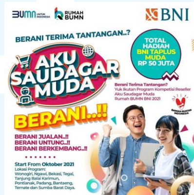
Gambar 2.5 Gambar promosi Aku Saudagar Muda

ini menggunakan desain poster, desain social media post , digital banner , dan booth design . BNI juga membantu UMKM melalui berbagai pihak, salah satunya menggunakan kontribusi dari kalangan muda.