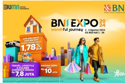
Gambar 2.6 Gambar promosi BNI EXPO 2024

Aku Saudagar Muda adalah acara yang diadakan oleh Rumah BUMN BNI. Acara ini adalah pelatihan kawula muda untuk menjadi reseller produk UMKM. Acara ini menggunakan desain social media post dan digital banner .