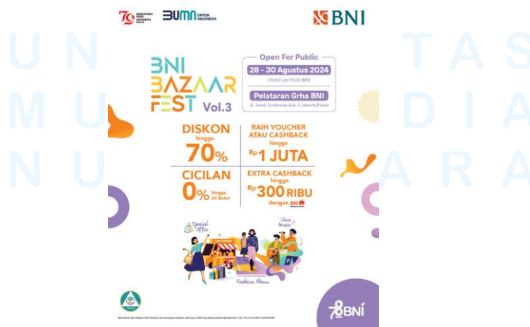
Gambar 2.4 Gambar promosi BNI Bazaar Fest Vol. 3

Selama masa kerjanya, BNI telah mengadakan beragam kampanye atau event . Acara-acara tersebut telah dihadiri banyak orang dan menunjang kepercayaan masyarakat terhadap BNI. Pertama adalah BNI Bazaar Fest Vol. 3.