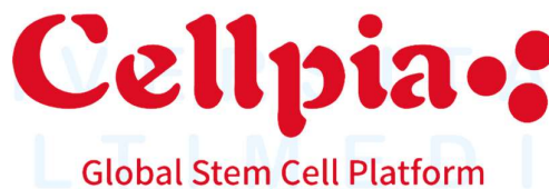
Gambar 2.4 Logo Cellpia

Cellpia Clinic adalah sebuah klinik yang secara eksklusif berfokus pada regenerasi stem cell guna meningkatkan kesehatan dan kualitas hidup sambil juga membantu memperpanjang umur melalui pengobatan stem cell yang telah teruji keamanannya. Berdiri pada tahun 2015, Cellpia terus berkomitmen untuk menyumbang pengobatan beragam penyakit dan meningkatkan kesehatan masyarakat melalui inovatifnya pengembangan terapi stem cell yang telah dibuktikan efektif dan aman di seluruh dunia.