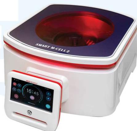
Gambar 2.5 Mesin SMART M-CELL 2

SMART M-CELL adalah mesin pengumpul stem cell yang diciptakan oleh Miracell dan Cellpia, menggunakan teknologi maju dari Harvard Medical School . Mesin ini dapat secara otomatis mengonsentrasi stem cell dengan tingkat kehidupan 98%, dan prosesnya hanya membutuhkan waktu 17 menit. Alat ini tidak hanya mengumpulkan stem cell tetapi juga memisahkan faktor pertumbuhan, platelet, dan sel imun yang sangat berguna untuk regenerasi jaringan dan penyembuhan luka.