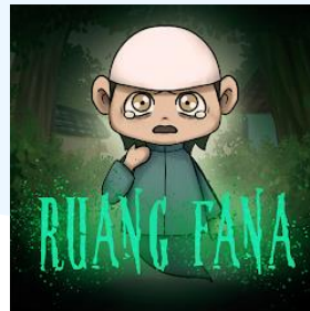
Gambar 2.6 Gim Ruang Fana oleh Memento Game Studio

Ruang Fana merupakan game mobile pertama yang dirilis oleh Memento Game Studio. Game ini menceritakan seorang arwah bernama Pandu. Pemain harus mencari Pandu harus mencari tubuh aslinya sebelum fajar menyingsing. Jika tidak, game akan langsung berakhir dan pemain harus mengulang permainannya.