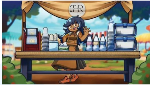
Gambar 2.5 Screenshot Salah Satu Scene Pada Gim Mrasa