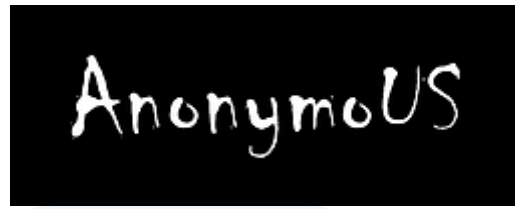
Gambar 2.3 Gim AnonymoUS oleh Memento Game Studio