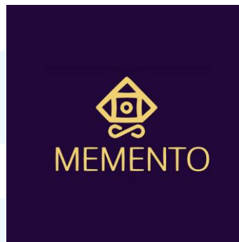
Gambar 2.1 Logo Memento Game Studio

menciptakan kolaborasi yang kuat serta mendorong pertumbuhan bersama yang berkelanjutan dalam ekosistem permainan global yang dinamis.